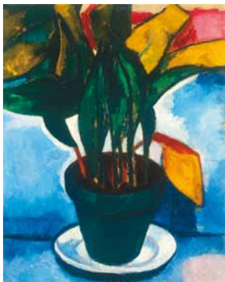
Czóbel Béla: Csendélet , 1908. magántulajdon