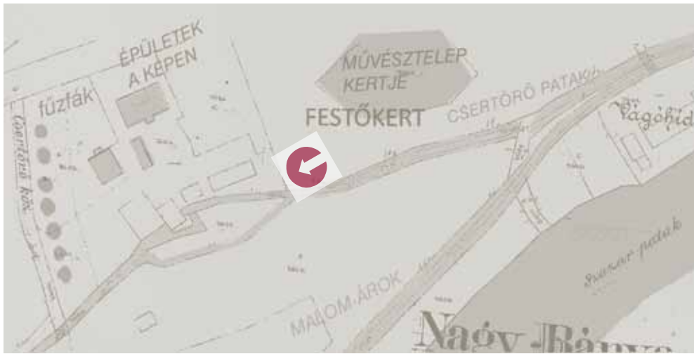
6. A nagybányai művésztelep kertjének alaprajza Boromisza Tibor: Őszi reggel , 1911, valamint Ziffer Sándor: Patak , 1911 című festménytémáinak helyszíne