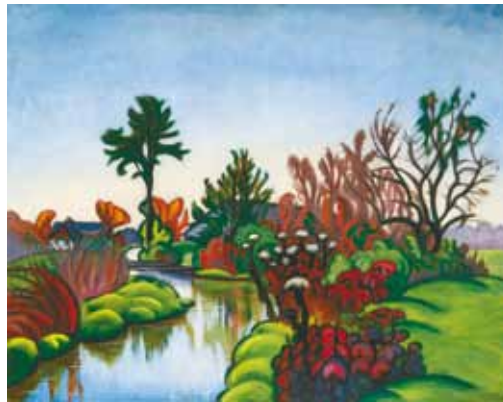
7. Ziffer Sándor: Patak , 1911 Magyar Nemzeti Galéria, Budapest 8. Boromisza Tibor: Őszi reggel , 1911 magántulajdon