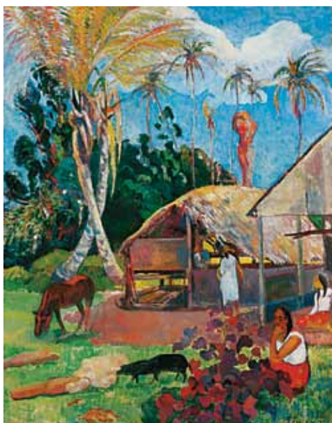
1. Paul Gauguin: Fekete sertések, 1891 Szépművészeti Múzeum, Budapest