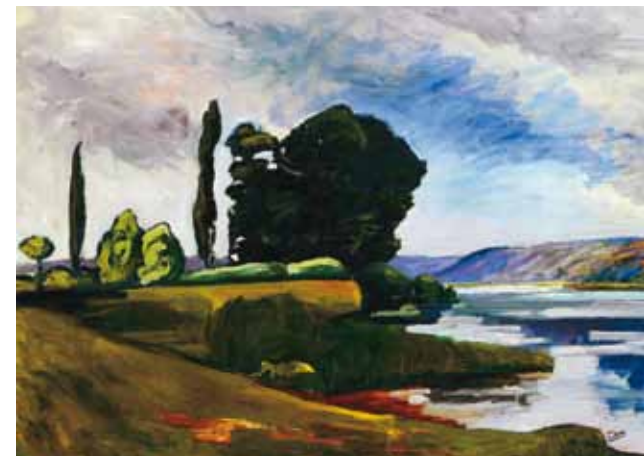
9. André Derain: A Szajna partja , 1899 körül magántulajdon

Ez szintézisének magva, melyet nem pusztán egyéni stílusának folyamatos érlelésével próbál egyértelművé tenni a festő. A szintézisre való hajlama tetten érhető például címadásaiban is, melyből a természet, az élet lüktető energiája és körforgása, valamint a fény, a megvilágítás jelentősége világlik ki. Akárcsak Csontváry képcímei esetében, programszerű gondolkodás fedezhető Boromisza tájképfestészetében is. A Művészház Palotaavató kiállításán, – melyen az Őszi reggel is szerepelt – Boromisza négy kiállított tájképe egy-egy évszakra felelt meg.