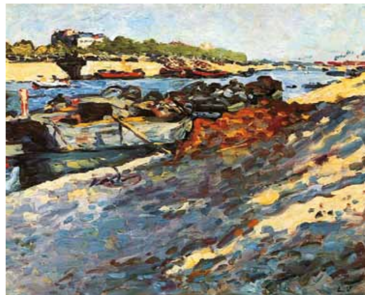
2. Louis Valtat: Hajók a Szajrán, 1905 magántulajdon

„Körmendi Frim Ervin festő és Körmendi Frim Jenő szobrász munkáiból, a Lipótvárosi Kaszinóban gyűjteményes kiállítást rendeztek. A két fiatal művész, kik hosszú ideig Párizsban éltek, igen érdekes munkákat mutatnak itt be. Fiatalságuk dacára igen erős kiforrott tehetségek. A gazdag anyagú kiállítás 10 napig marad együtt.” – adta hírül az Egyetértés című lap 1909. november 28-án. Ervin a Körmendi-testvérpár festőművész tagja a kor- és pályatársaihoz képest igen korán, már 1903-ban megérkezett Párizsba. A következő évtized java részét itt töltötte, ahol együtt dolgozott a későbbi Nyolcak és a magyar vadak művészeivel. 1906 és 1911 között rendszeres kiállítója volt a modern festészet nemzetközi seregszemléiként ismert párizsi tavaszi és őszi szalonoknak. Ebben az időszakban tizennyolc művét mutatta be a Salon des Indépendants és a Salon d'automne tárlatain. Körmendi Frim Ervin 1906-ban Czöbellel, Czigánnyal és Mikolával együtt érkezett haza a francia fővárosból, hogy együtt indítsák el a nagybányai neős forradalmat. Ők ismertették meg az ekkor Nagybányán tanuló és tanító művészeket a legfrissebb francia művészeti fejleményekkel,