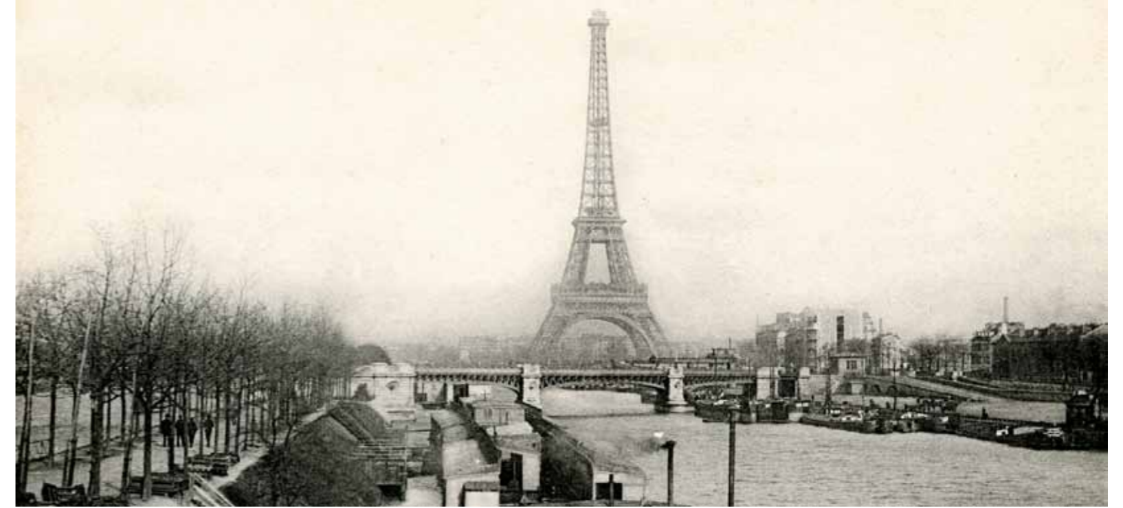
3. A Szajna látképe az Eiffel-toronyral - képeslap az 1900-as évek elejéről