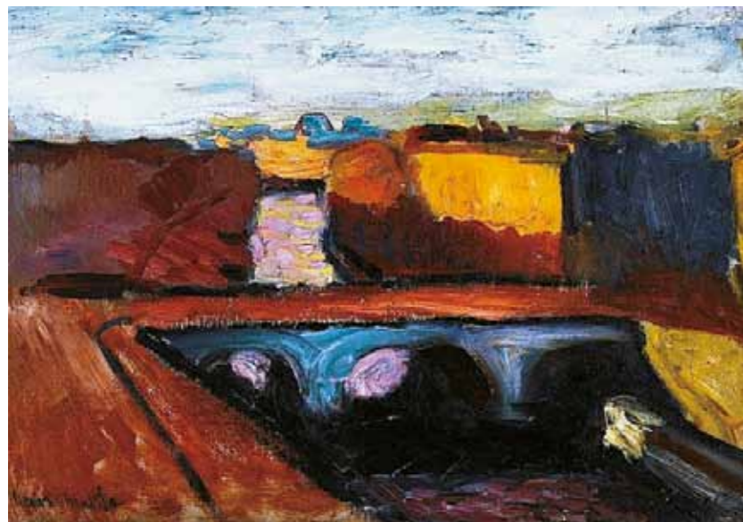
1. Henri Matisse: A Szajna látképe, 1904 magántulajdon