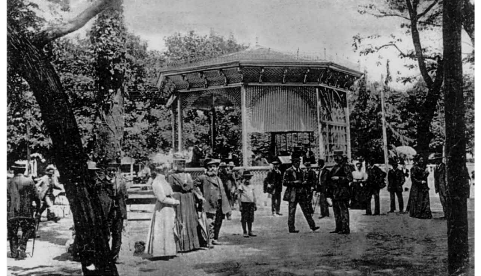
3. A zenepavilon Pöstyénben, 1900-as évek

A felvidéki Pöstyén már az 1800-as években ismert volt jótékony hatású fürdőiről és termálvizéről. Elegáns, klasszicista stílusban épült fürdőszállóival, épületeivel, árnyas parkjaival és korszerű, modern infrastruktúrájával a századfordulóra a Monarchia egyik legkedveltebb üdülőhelyévé vált.