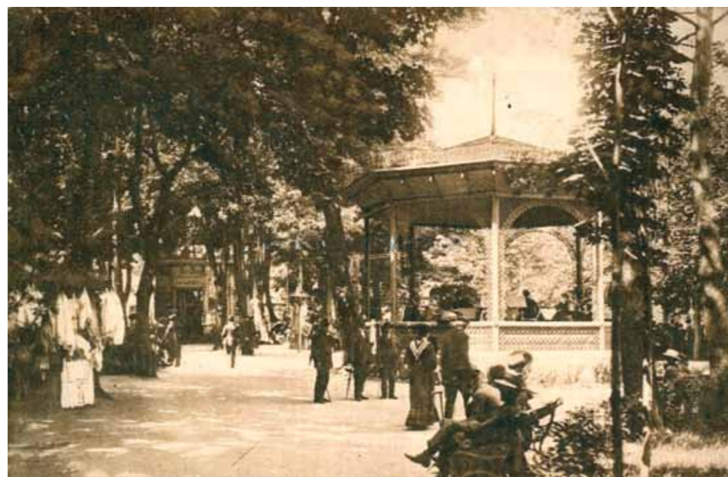
2. Pöstyén, 1910