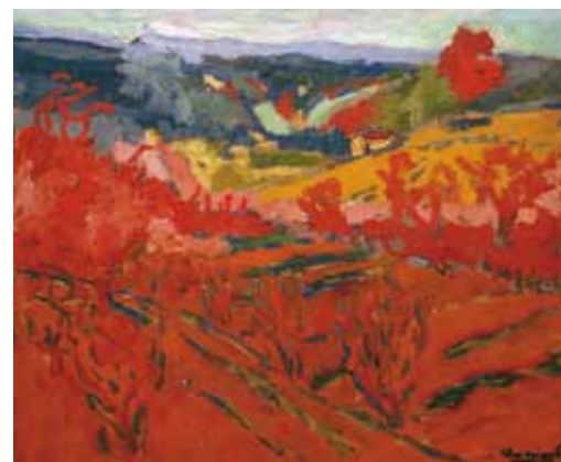
3. Maurice de Vlaminck: Őszi táj, 1905 Museum of Modern Arts, New York