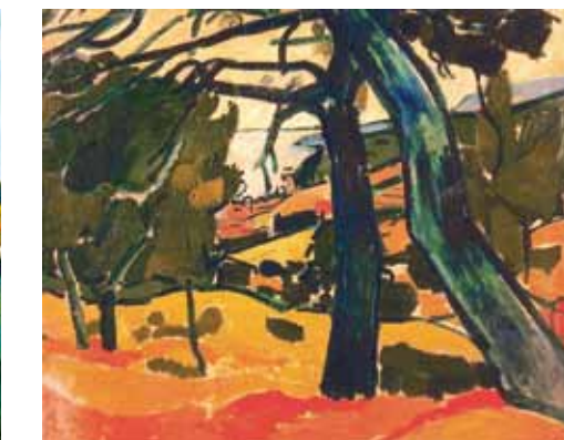
6. André Derain: Fenyőfák Cassisban (Tájkép), 1907 Musée Cantini, Marseille

Amikor egy olajfestmény vadonatúj «ruhában» bukkan fel több, mint egy évszázadnyi lapangás után, azaz megtisztítva, és újrakeretezve kerül a kutató elé, akkor indul a valódi nyomozás. Mi lehetett a mű eredeti, a művész által adott címe, hol volt kiállítva, írtak-e róla, kik voltak a tulajdonosai az idők során és merre járt a nagyvilágban?