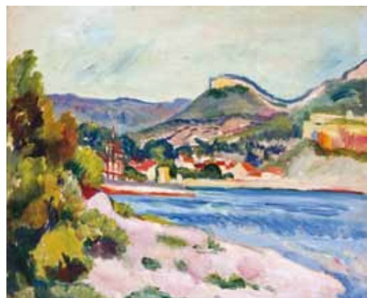
1. Henri Manguin: Cassis, 1912 magántulajdon

VI. Csoportos Kiállítás a Művészházban. Budapest, 1912. február, katalógus: 81. Nagybányai Jubiláris Képkiallítás. Nagybánya, 1912. augusztus 1-31., katalógus: 152.