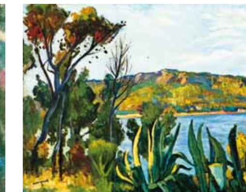
5. Albert Marquet: Agay látképe, 1905 Musée d'Orsay, Párizs