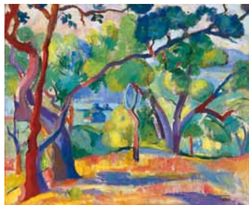
2. Henri Manguin: Saint-Tropez vidéke, 1904 magántulajdon