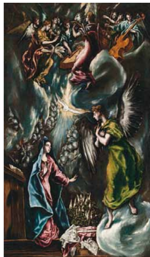
2. El Greco: Angyali üdvözlés, 1596–1600 Museo de Bellas Artes de Bilbao, Bilbao