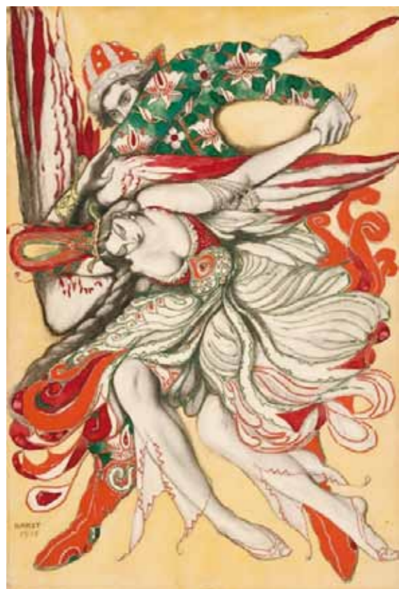
1. Leon Bakst: Ivan herceg elfogja a tűzmadarat, 1915 magántulajdon