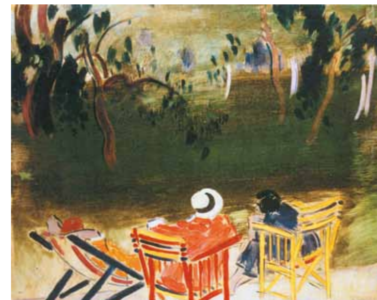
7. Vaszary János: Parkban, 1928 Magyar Nemzeti Galéria, Budapest

utolsó és leghosszabb korszaka is erre az időszakra esik. A naturalista, realista kezdetek után a szecesszió, az impresszionizmus, később az expresszionizmus felé fordult. 1925-ös párizsi látogatását követően a nagy kolorista, egy újabb éles fordulat után, az École de Paris szellemében alkotott; a nagyvárosi, majd később a tengerparti fürdőhelyek, a parkok, a nők, a virágok és a szépség, valamint az életöröm festője lett.