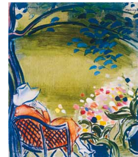
8. Vaszary János: Nő kerti székben, 1930 körül Magyar Nemzeti Galéria, Budapest