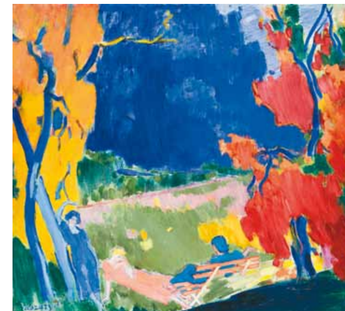
14. Vasary János: Ősz, 1938 magántulajdon