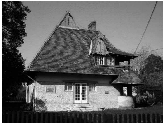
1. A Vaszary villa az 1910-es években