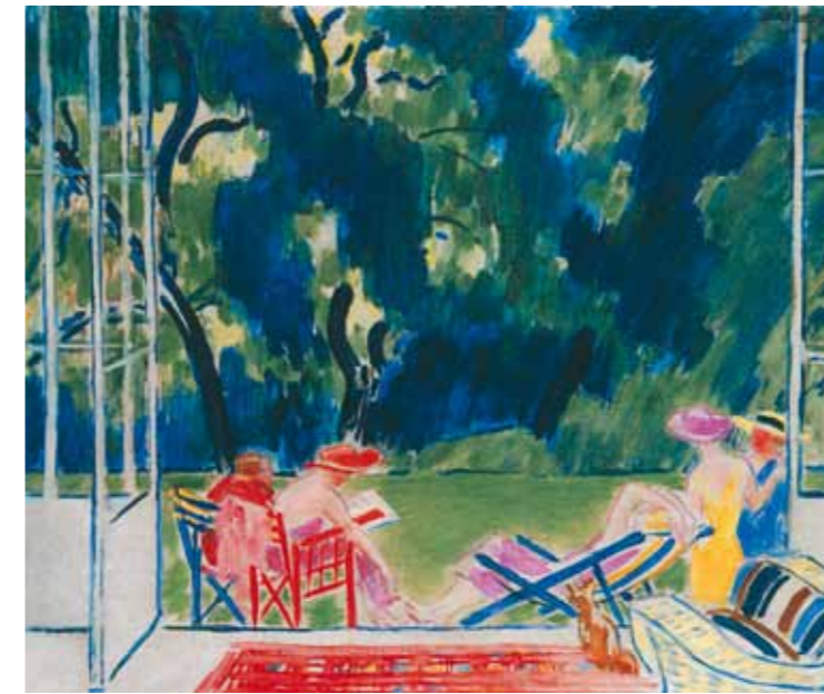
5. Vaszary János: Parkban, 1936 Magyar Nemzeti Galéria, Budapest