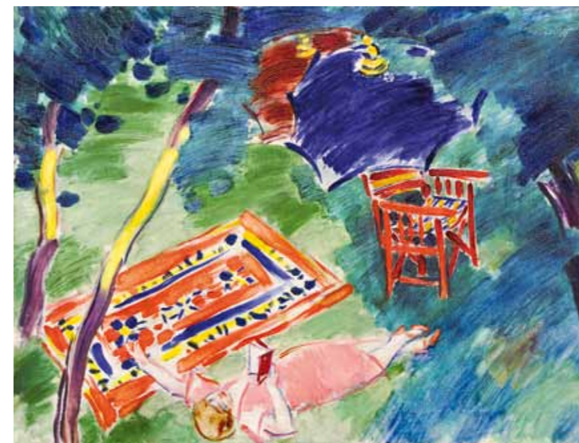
13. Vasary János: Pihenők a kertben magántulajdon