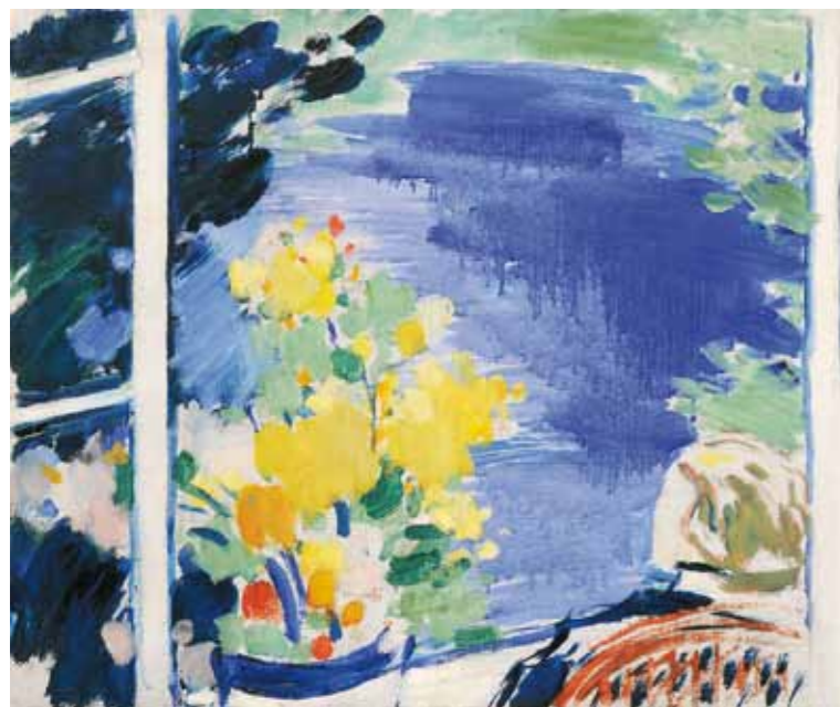
9. Vasary János: A tatai kert ablakában, 1930 körül magántulajdon