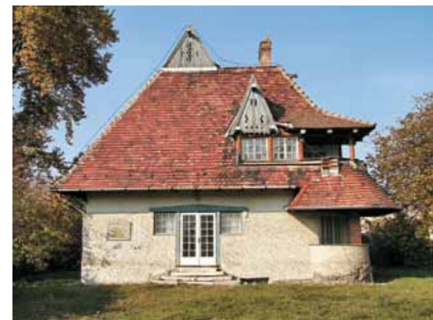
2. A Vaszary villa 2000 körül