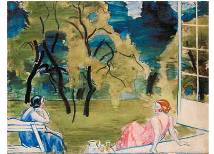
6. Vaszary János: Veranda két nővel, 1933 körül Magyar Nemzeti Galéria, Budapest

A zavartalan elvonulásra a 30-as évektől egyre nagyobb szüksége volt Vaszarynak. A szabad szellemű, nagy erkölcsi tartással és kiváló ízléssel, műveltséggel rendelkező Vaszary a magyar képzőművészet egyik legfontosabb szereplője volt, aki nemcsak művészként és teoretikusként, hanem köztisztelőként álló pedagógusként is rendszeresen hallatta a hangját a magyar kul-