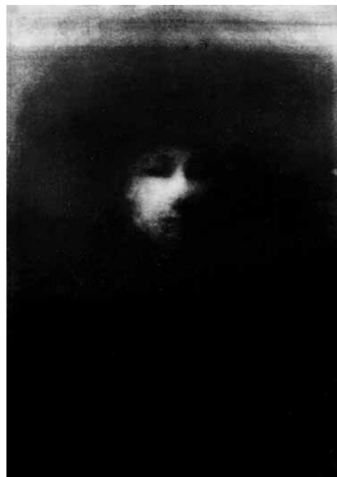
2. Birkás Ákos: Rembrandt, az önarckép fantomja, 1977 magántulajdonban

A Fej-sorozat Birkás Ákos életművének legismertebb, emblemikus műcsoportja. A sorozat számos darabját bemutatta a művész a grazi Neue Galerie-ben (1987), a bécsi Museum des 20. Jahrhunderts-ben (1996) és a budapesti Ludwig Múzeumban (2006) rendezett átfogó kiállításain. A festmények radikális formai redukció eredményei: az 1980-as évek közepétől az 1990-es évek végéig Birkás festményeinek kizárólagos motívumává vált a pasztózus képmezőben megjelenő ovális forma. A motívumot hol függőleges, hol vízszintes, hol koncentrikus ecsetvonásokkal alkotja meg, egy zárt, belső alakzatot írva a nyitott képmezőre.