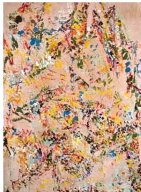
A festmény hátoldala