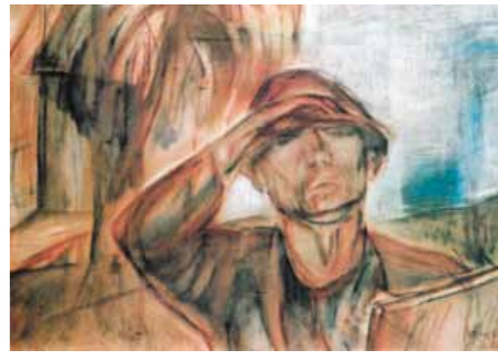
3. Egrý József: Önarckép napsütésben, 1927 Magyar Nemzeti Galéria, Budapest