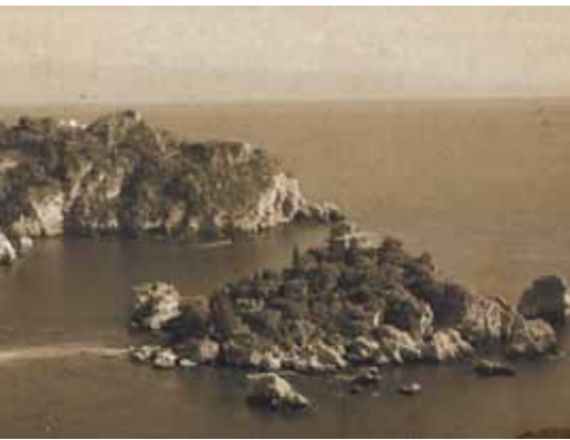
2. Taormina látképe az 1930-as években