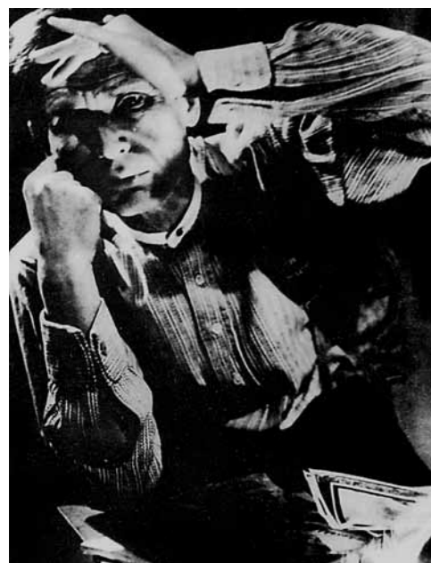
1. Egrý József a műtermében, 1930-as évek