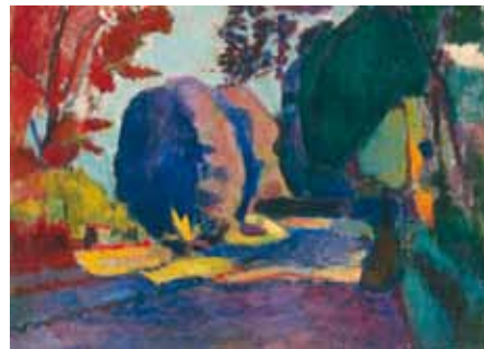
Henri Matisse: A Luxembourg-kert, 1901 Ermitázs, Szentpétervár