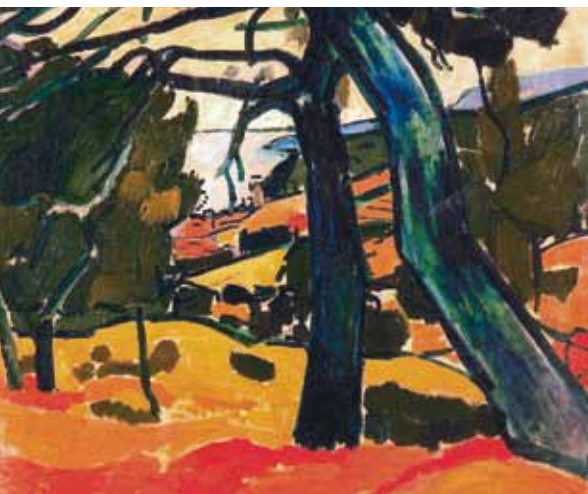
André Derain: Tájkép, 1907 Musée Cantini, Marseille