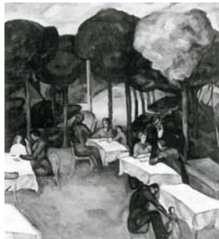
Perlrótt Csaba Vilmos: Vendéglő kertje magántulajdon