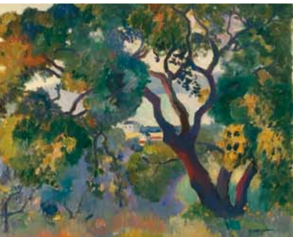
Henri Manguin: Táj Saint-Tropez-ben Ermitázs, Szentpétervár

Az építési munkálatok iránt joggal érdeklődő festők gyakran kilátogattak a helyszínre, egyik ilyen alkalommal ragadhatta meg Perlrott figyelmét a park fái alatt meghúzó vendéglő látványa, így feltehetően ekkor festette mind a ma lappangó, rendkívül érdekes Vendéglő kertje c. képet, mind a jelen elemzés tárgyát képező Parkban-t , amely jól beazonosíthatóan a Műkert egyik szegletét ábrázolja, előtérben a vendéglő skurcban látott egyik asztalával és széktámláival. A tér szinte síkban történő kivetítése már jelzi a kibontakozóban lévő kubizmus ismeretét, de a kép még egyértelműen a Matisse-kör stílusához köthető és bizonyosan megelőzi Perlrott 1911-es spanyolországi tanulmányútját.