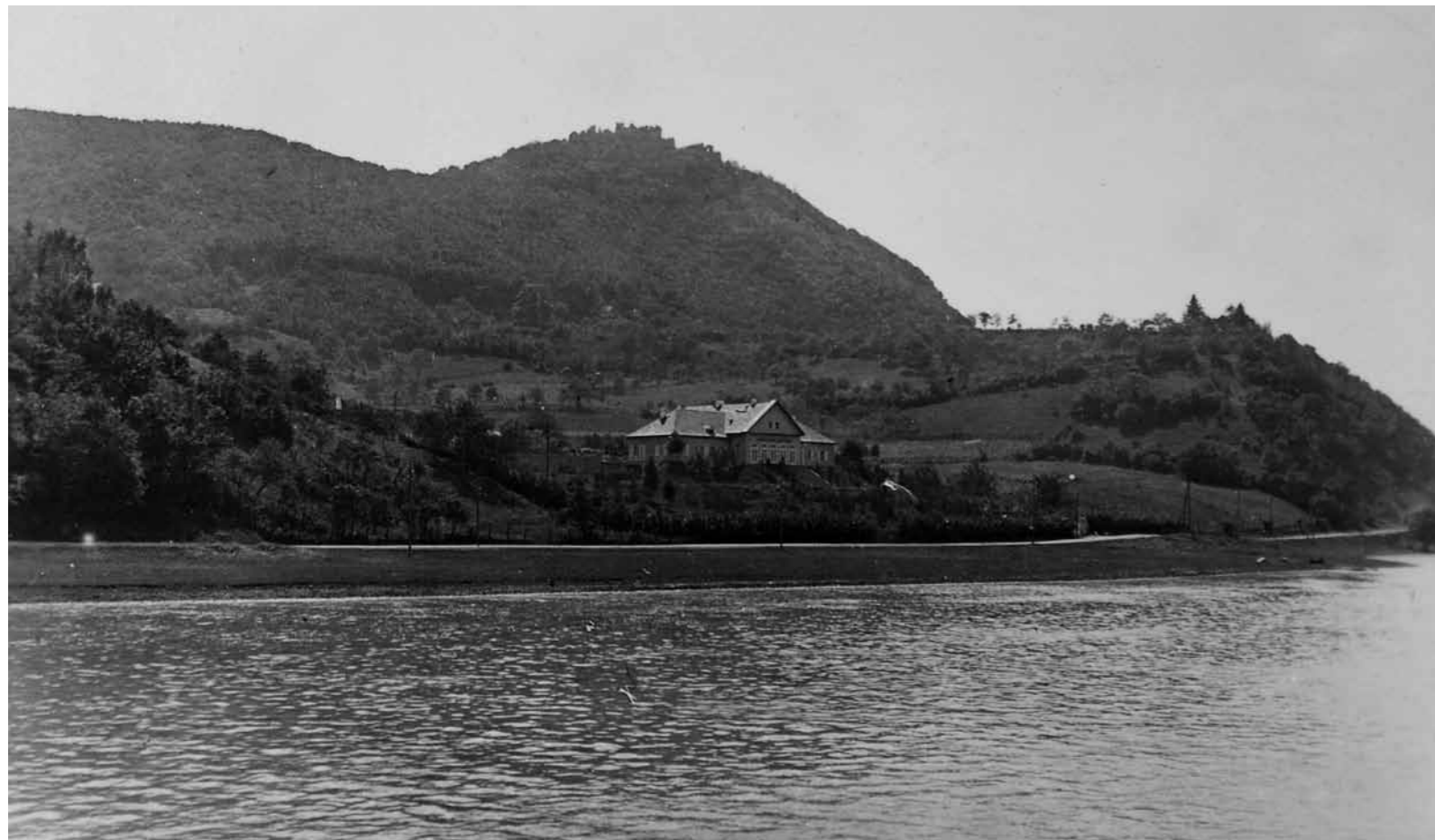
1. Dunakanyar, 1936

tartó tényezőkről egy 1955-ös interjúban. Szőnyi 1924-ben ismerte meg Zebegényt, és ettől kezdve élete elválaszthatatlanná vált a Dunakanyarban meghúzódó településtől. A továbbiakban az év nagyobbik részét családjával együtt már itt töltötte, csak a téli hónapokban tartózkodott Budapesten.