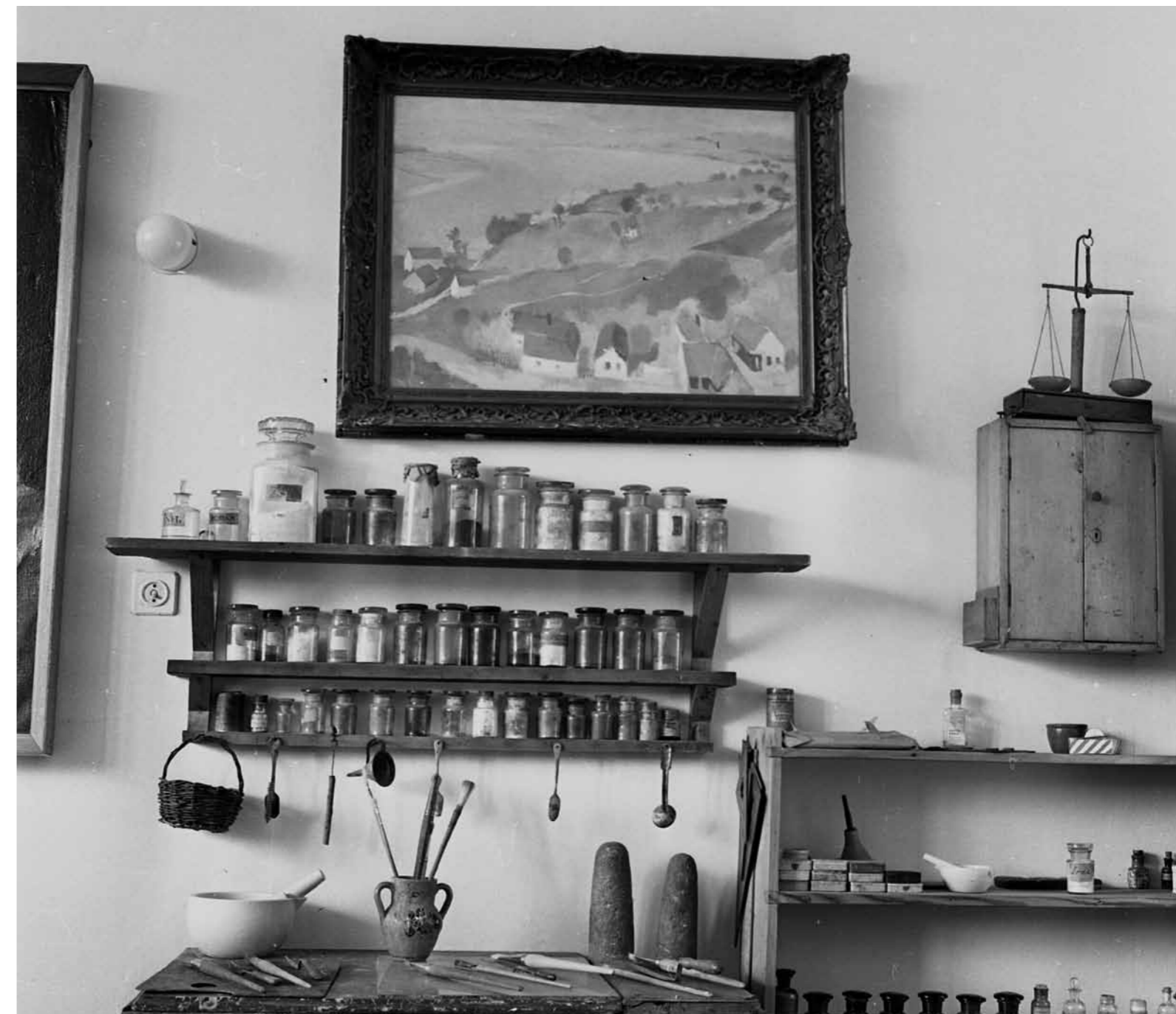
2. Szőnyi István egykori műterme Zebegényben, 1970-es évek