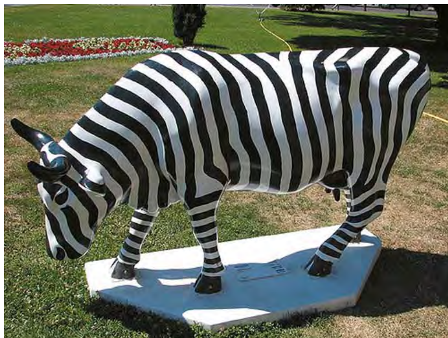
1. A kiállított művek, Cow Parade, Budapest, 2006