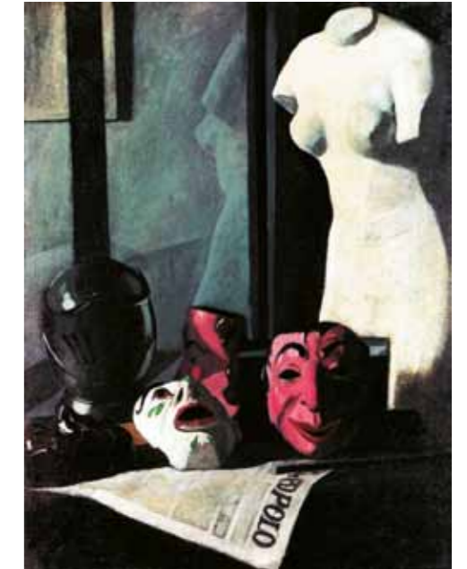
4. Felice Casorati: Maszkok, 1921 magántulajdon