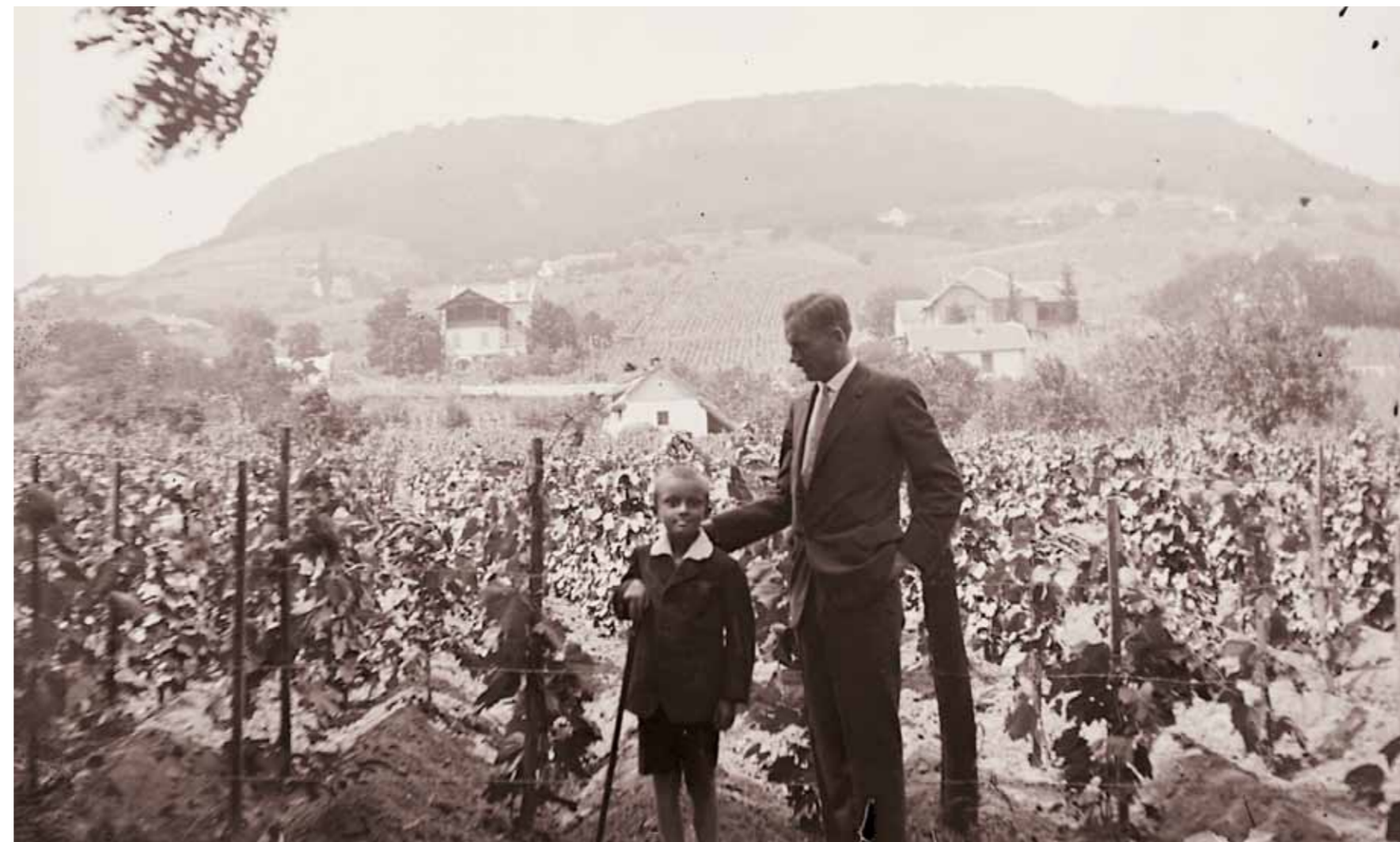
3. Badacsony, 1926

„Csak állt ott szinte megdermedten, tágra nyílt szemmel, révületben, mint aki magába akarja fogadni ezt az egész tengernyi vizet. Abban a pillanatban két felhő között bukott ki, nem maga a nap, csak egy sugárkévéje. A víznek és az egész valóságnak olyan fantasztikus szikrázásával, mintha Egry valamelyik tóparti képét idézné. Mivel annyira elmerült ebben a látványban, hogy közeledésemet nem vette észre, pár lépésnyire tőle megálltam, és nem szóltam hozzá. Magam is némán és meghatatottan álltam. Meghatott szemlélője voltam ennek a valószínűtlen színjátéknak.” – írta a művészrel való utolsó találkozásáról Bálint Lajos, a kiváló színházi és képzőművészeti kritikus, 1973-as Ecset és véső című tanulmánykötetében. Akik valaha akár csak pár napot is eltöltöttek a Balatonnál, azoknak közös és meghatározó élménye a „magyar tenger” különleges atmoszférája, fényviszonyainak minden év- és napszakban állandó változásával gyönyörködtető, varázsos hangulata.