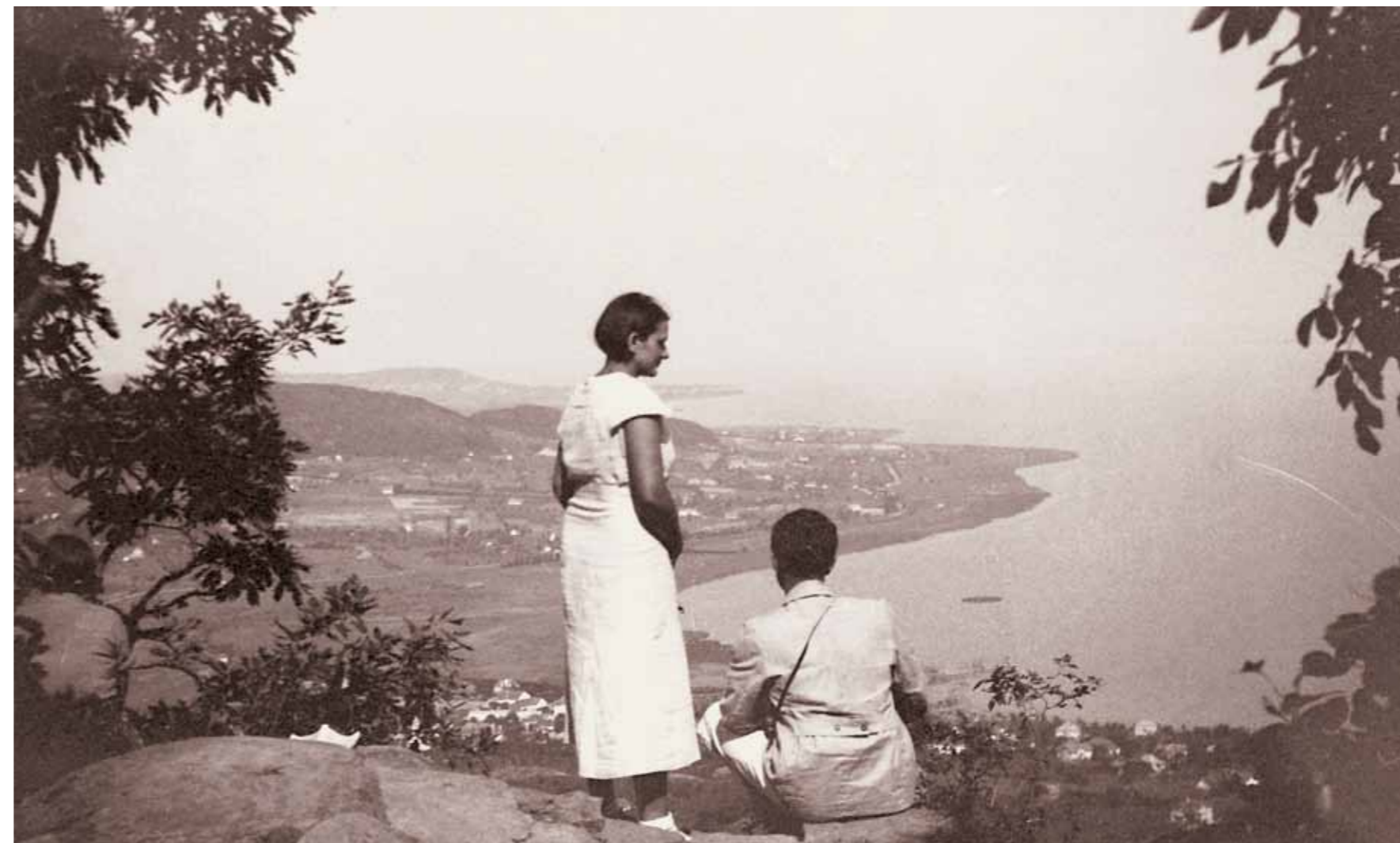
4. Kilátás a Badacsonyból, 1928