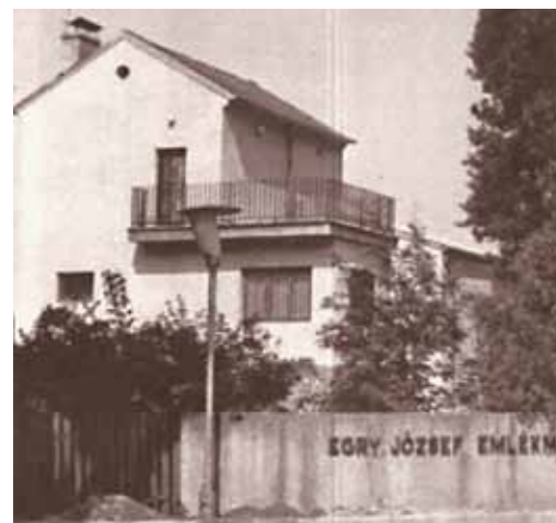
1. Egry József egykori műterme Badacsonyban (ma múzeum), 1973

„Egry József 1916-ban ismerkedett meg ezzel a csodával, hogy a Balaton azután élete végéig búvőkörében tartsa.”