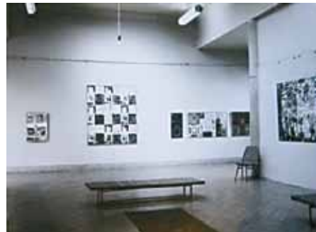
Enteriőrfotó, Ország Lili kiállítása, 1972. A falon a Stanzák I. látható.