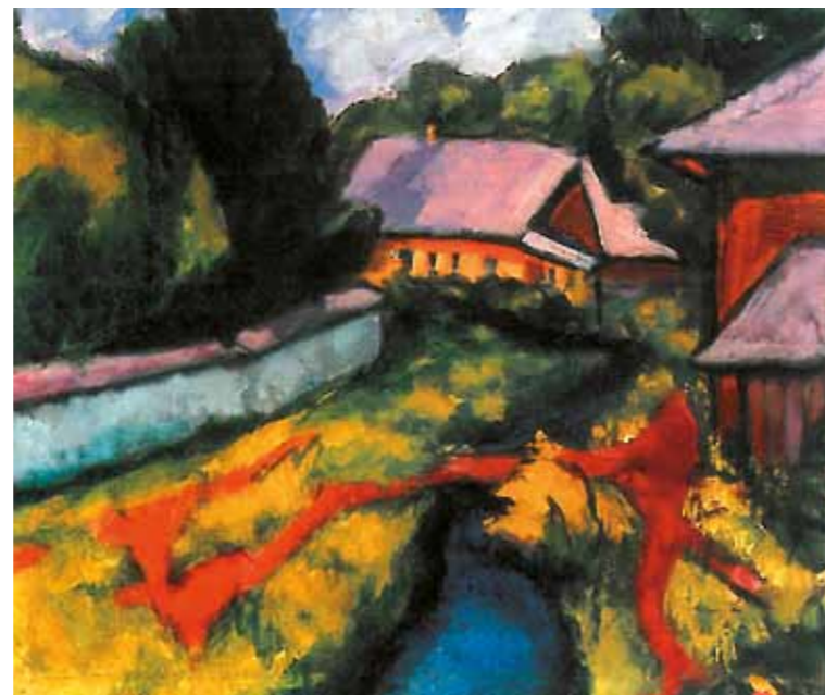
4. Tihanyi Lajos: Kis tájkép, 1909. Janus Pannonius Múzeum, Pécs