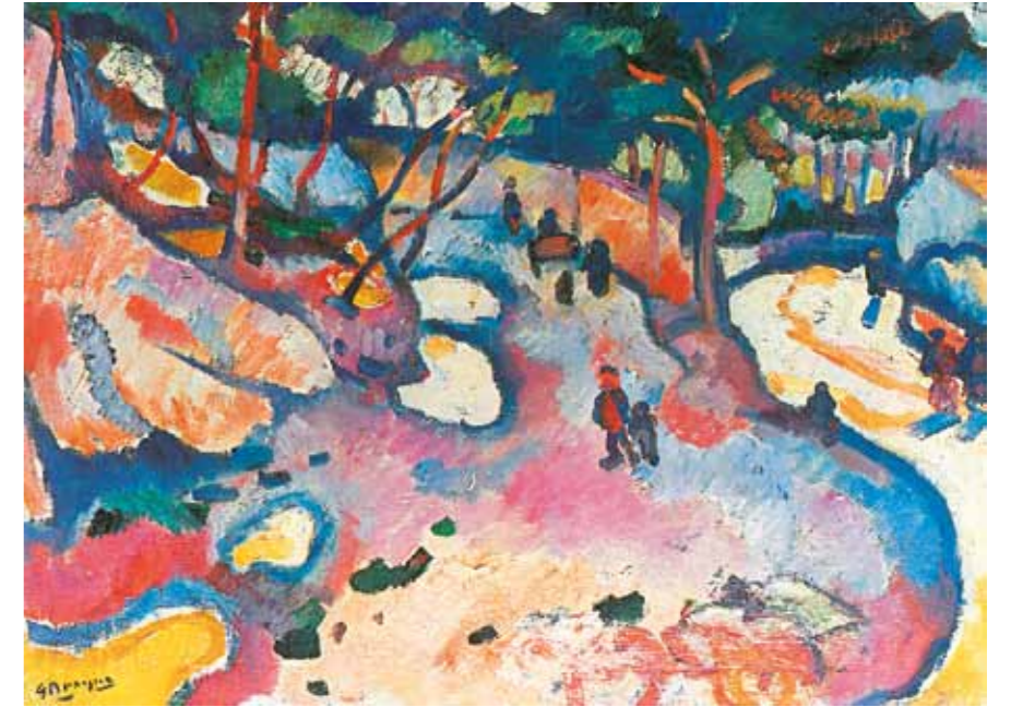
5. Perrott Csaba Vilmos: Nagybányai utca, 1909. magántulajdon