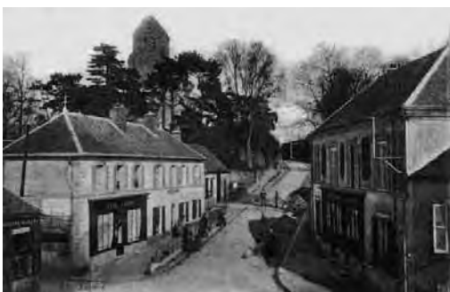
2-3. Gros Rouvre a 20. század elején