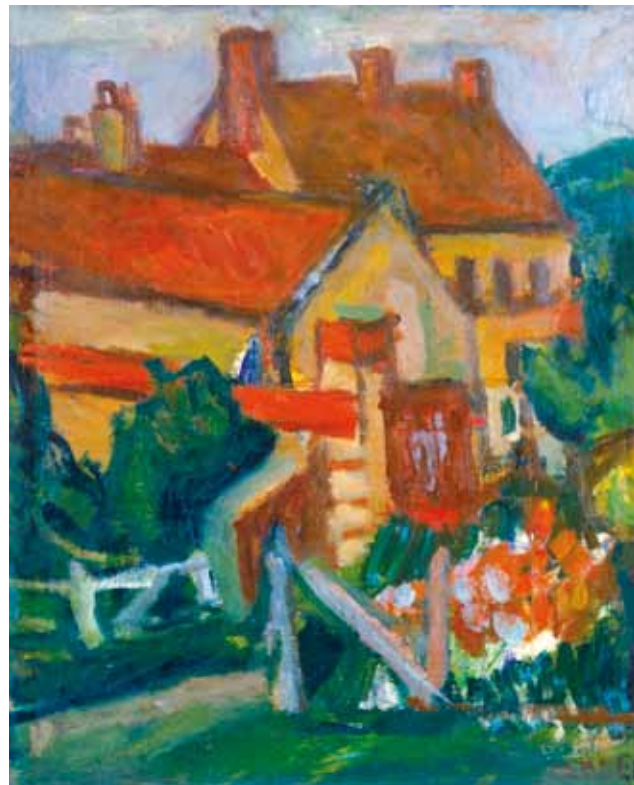
5. Czöbel Béla: Sárga házak, piros tetők (Tájkép, Gros Rouvre-i házak), 1927 magántulajdon