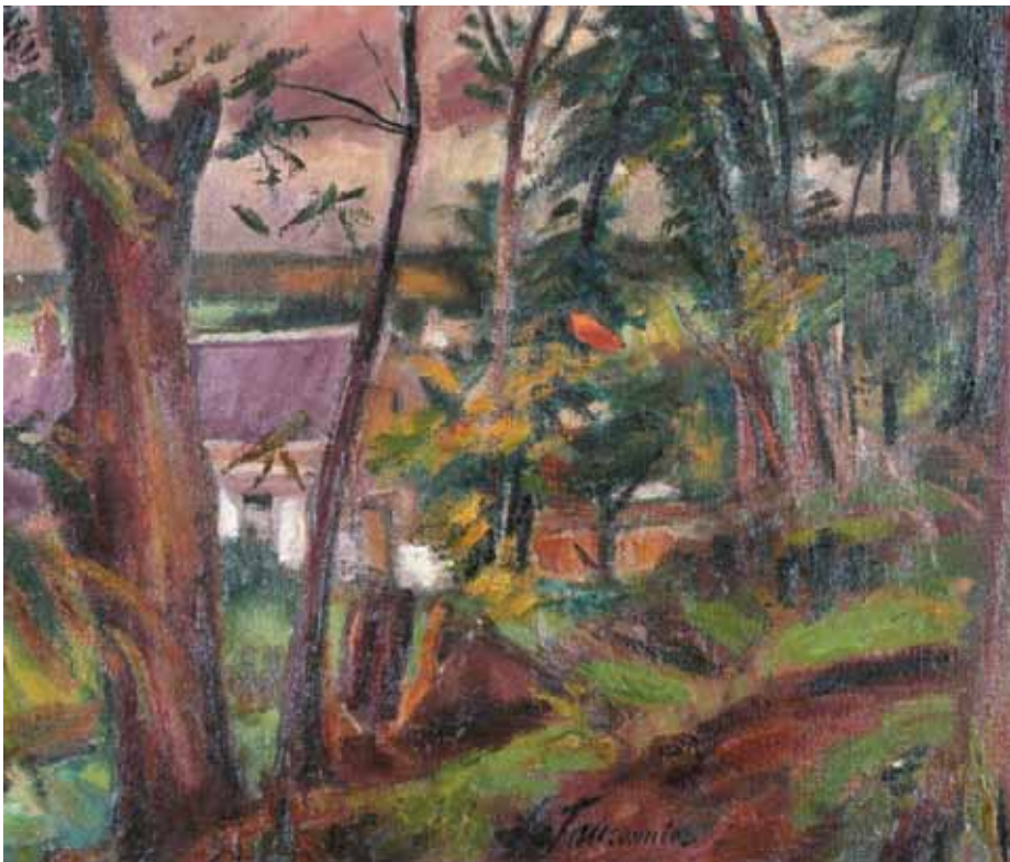
4. Henri Le Fauconnier: Liget Gros Rouvre mellett, 1930-as évek magántulajdon