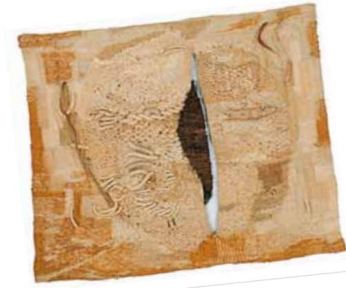
2. Magdalena Abakanowicz: Fehér , 1966, Central Museum of Textiles, Łódź, Lengyelország

A hatvanas évek végére a festészet addigi egyeduralma az egyéb képző- és iparművészeti ágak felett megtörni látszott. Mind többen kérdőjelezték meg a festészet érvényességét; a művészek egy része szabadulni akart a falakról, és szó szerint a keretektől, kötöttségektől, valamint széles körűvé vált a gyakorlatban, hogy a különféle művészeti ágak összemoshatóak, az alkotók áttévedhetnek egymás területére, a műfaji szabályok kötetlenebbek. Itthon főként az ekkor beérett fiatalok, vagyis Keserű generációja kísérletezett a festészet újraértelmezésével: a formázott vászontól kezdve, a vászondomborításokon és a különféle tárgyak képre applikálásán át (ld. a katalógusban Konkoly: Második világháború , 1967) a varrásig (ld. a katalógusban Paizs László: Bőrös kép , 1967) és alternatív anyaghasználatokig (ld.: Pinczehelyi Sándor: Napszivatas , 1973). Keserű Ilona az elsők között fordult a varráshoz, de nem alkalmazott műfajként