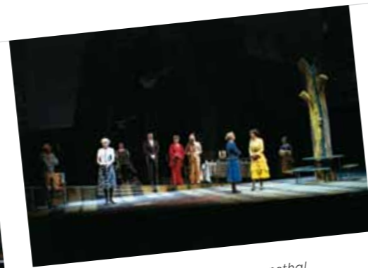
4. Jelenet Hugo von Hoffmannsthal A megvesztegethetetlen című darabjának 1. felvonásából