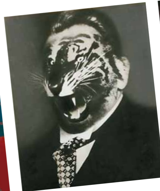
6. John Heartfield: Az SPD krízis-ülése, fotómontázs