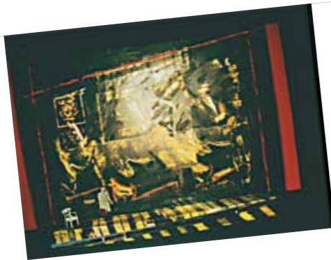
2. Hugo von Hoffmannsthal A megvesztegethetetlen című darabjának színpadi terve, mely Lakner László Metamorfózis című műve alapján készült. Bemutató: 2003. október 25-én, a Burgtheater in Wienben