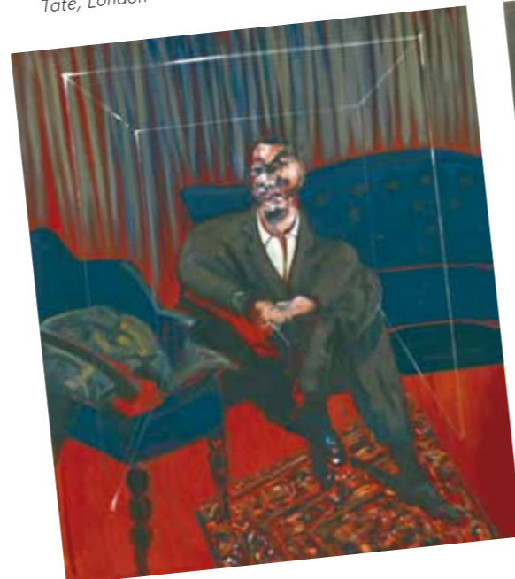
5. Francis Bacon: Ülő figura, 1961 Tate, London