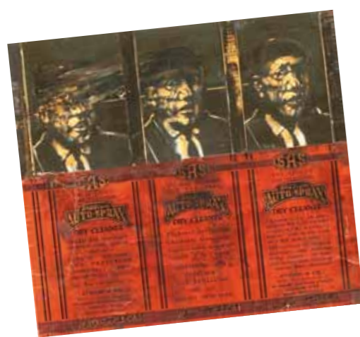
1. Lakner László: DOMA portré (Előtanulmány a Metamorfózishoz), 1965