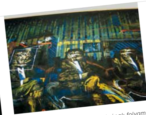
3. A színpadi díszlet előállításának folyamata