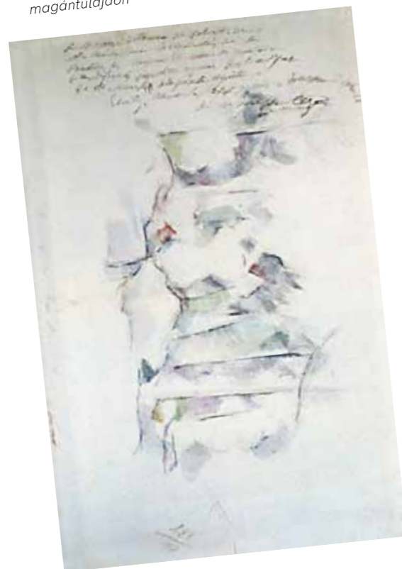
1. Paul Cézanne: Fôret , 1880-1885 (FWN 1093-TA), magántulajdon

Az 1970-es évek kulcsfontosságú periódus Lakner László művészetében. Az évtized elején a művész a konceptuális fotó- és szövegművek, filmek és könyvobjekttek mellett konceptuális szellemiségű fotórealista festményeket alkotott - elsősorban történelmi dokumentumokat festett meg monumentális léptékben, és így egyaránt reflektált társadalmi és történelmi folyamatokra, illetve a kulturális és a társadalmi emlékezet kérdéskörére. Lakner 1972-ben Essenben töltött hosszabb időt a Museum Folkwang ösztöndíjának köszönhetően, majd 1974-ben elnyerte a DAAD Berliner Künstlerprogramm ösztöndíját, amely lehetővé tette, hogy végleg Nyugat-Németországba költözzön. Az 1974-et követő időszak hozta meg számára a nemzetközi áttörést: 1974-ben az aacheni Neue Galerie - Sammlung Ludwigban, 1975-ben a Neuer Berliner Kunstvereinban nyílt önálló kiállítása; 1976-ban bemutatták műveit a Velencei Biennálé nemzetközi kiállításán, és ugyanebben az évben elnyerte a nagy tekintélyű Deutscher Kritikerpreis; 1977-ben pedig