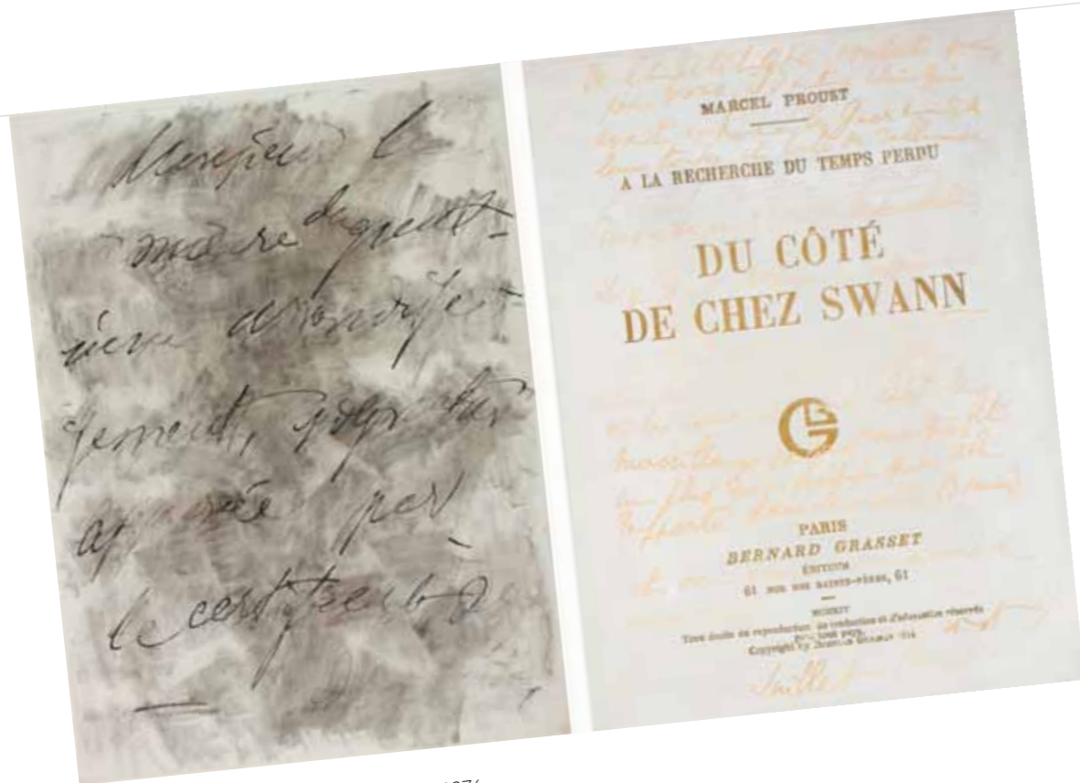
2. Lakner László: Cézanne utolsó levele, 1976, Museum Boijmans Van Beuningen, Rotterdam, Hollandia

E „pszeudo-faksimile” kéziratos festmények sorába illeszkedik az a sorozat, amelyet Lakner a modern festészet egyik legfontosabb alakjának, Paul Cézanne-nak szentelt. A nagyléptékű szénrajzokon és az érzékeny lazúros festményeken Cézanne leveleinek – például utolsó levelének – részletei jelennek meg. A P.C. (Paul Cézanne) levéltöredéke 5. (1977) című alkotás Lakner Cézanne-sorozatának része. A mű előképe a francia festő egyik levélvázlata, amely egy 1880-85 közé datálható akvarell szélén olvasható (Paul Cézanne: Forêt , 1880-85, oeuvre kat. FWN 1093-TA; Rewald: W154). Lakner nem az írások tartalmával foglalkozik (ezúttal egy hétköznapi, „hivatali” levél vázlatát használja fel), hanem sokkal inkább a kéznyomok festői feldolgozása során alkot meg – Heiner Stachelhaus találó kifejezése szerint – „írás-portrékat”, amelyek hűen tükrözik a gondolat születésének a folyamatát: arcnélküli arcképekként