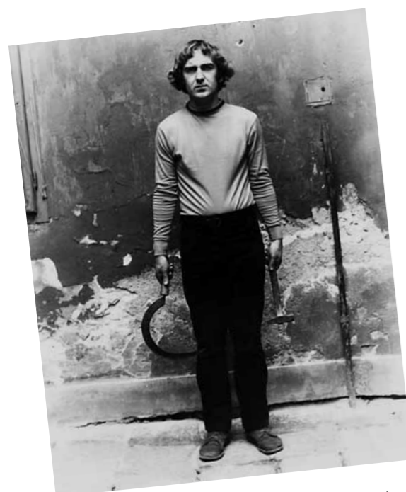
2. Pinczehelyi Sándor: vázlat a sarto és kalapácshoz, 1973

| Pécsi Műhely Nagy képeskönyv. Pinczehelyi Sándor, Alexandra Kiadó, Pécs, 2004, 26. oldal | Kovalovszky Márta: Pinczehelyi Sándor. Pécs, 2010, 42. oldal | Párhuzamos avantgarde - Pécsi Műhely 1968-1980. Ludwig Múzeum, 2017, 233. old.