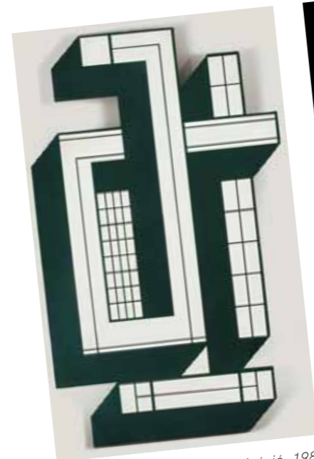
3. Bak Imre: Alakos improvizáció, 1982 magántulajdon