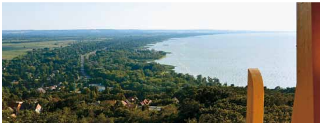
1. Kilátás Balatonfenyves felé a fonyódi Várhegy-kielátóból