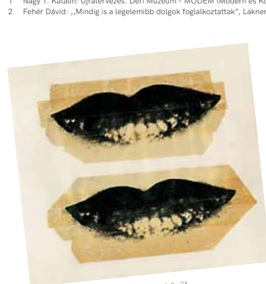
1. Andy Warhol: Lips, 1975 körül Danziger Galéria, New York