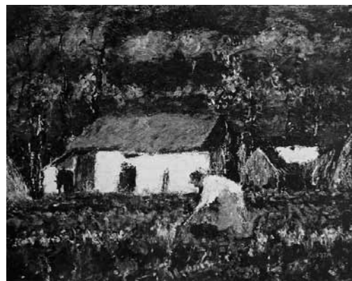
1. Koszta József: Tanya Közölve: Vitéz Nagy Zoltán: Új magyar művészet, Athenaeum, Budapest, 1941., 33. tábla