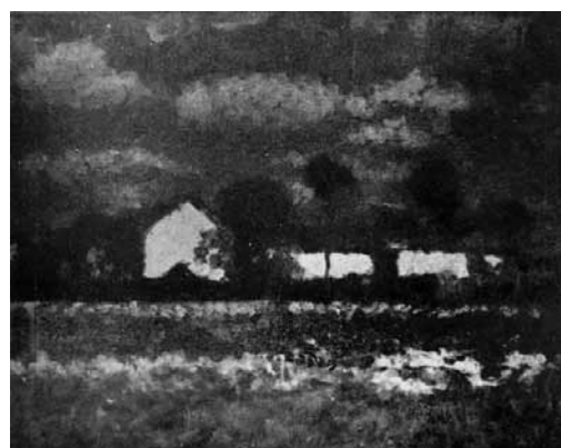
2. Koszta József: Tanyák Közölve: A Szinyei Merse Pál Társaság Jubiláris (VII.) kiállítása, Nemzeti Szalon, Budapest, 1940. január-február, katalógus: 59.

núskodik, hogy 1940-re a a Szinyei Merse Pál Társaság elveszítette kezdeti lendületét, még a legnagyobb nevek is, csak viszonylag jó képeket tudtak felmutatni e vészterhes időkben. "A háborúban hallgatnak a műzsák", ezt a bölcsességet példázza ez a katalógus is, melyből Koszta egyetlen ekkor bemutatott műve, még a színek hiányában is messze kimagaslik az átlagból.