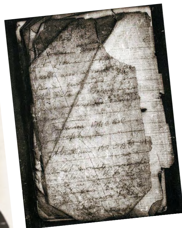
2. Walt Whitman arcképe, 1871