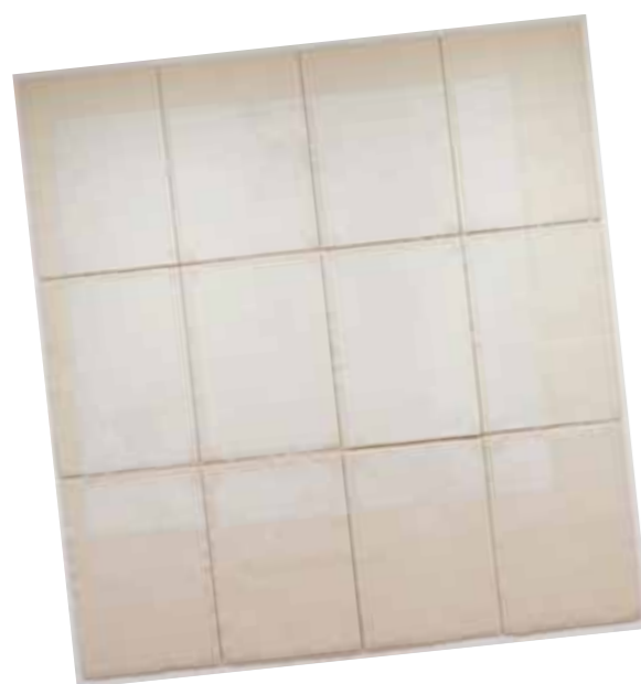
1. Robert Ryman: Classico 5 . Modern Museum of Art, New York

| Frank Peege (aukción), 2009. április 4., 993. tétel