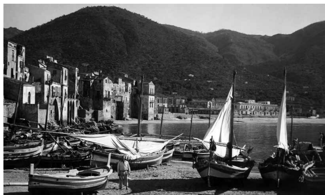
1. Cefalú, 1930-as évek archív fotó

Kezdő ár | Starting price: 12 000 000 Ft / 33 333 EUR Becsérték: 20 000 000 – 30 000 000 Ft Estimate: 55 556 – 83 333 EUR