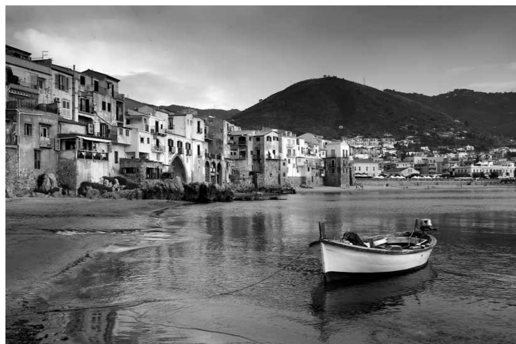
2. Cefalú, 1930-as évek archív fotó