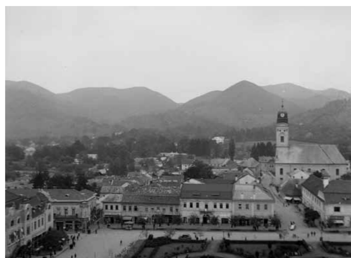
2. Nagybánya, Rákóczi tér a Szent István-toronyból nézve, 1939