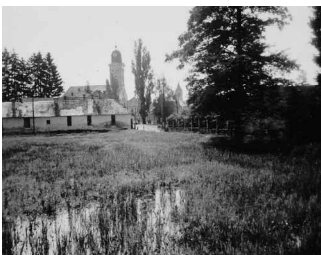
1. Nagybánya, református templom, 1941

REPRODUKÁLVA | REPRODUCED: | Borghida István: Ziffer Sándor. Kriterion Könyvkiadó, Bukarest, 1980., 45. kép | A László Károly-gyűjtemény, | Fővárosi Képtár – Múcsarnok, Budapest, 1996., 110.