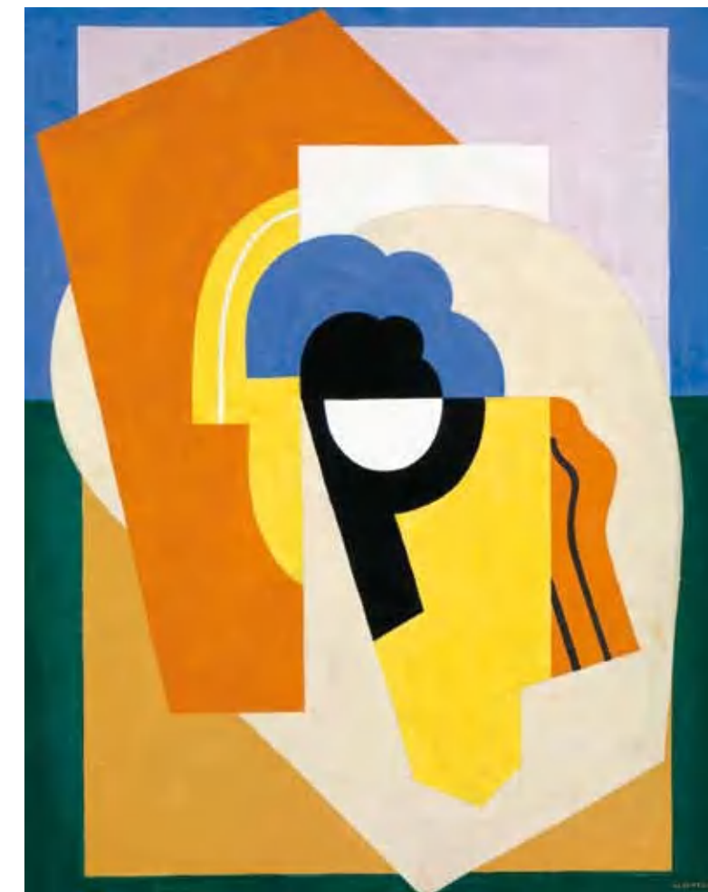
4. Albert Gleizes: Festmény, 1921 TATE Gallery, London