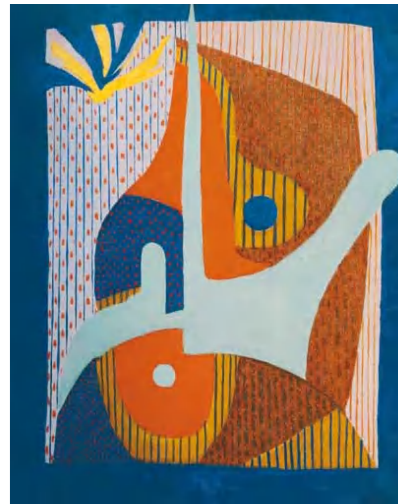
3. Tihanyi Lajos: Absztrakt festmény, 1933 Magyar Nemzeti Galéria, Budapest

önálló kiállítással a galériában. Az 1930-as évek elején mindkét barát, Beöthy és Réth is meghatározó szerepet vívott ki a frissen megalakult Abstraction-Création csoportban, melynek kötetelike új nyilvánossági fórumot, bemutatkozási lehetőséget jelentett az egyre inkább elszigetelődő Tihanyi számára.