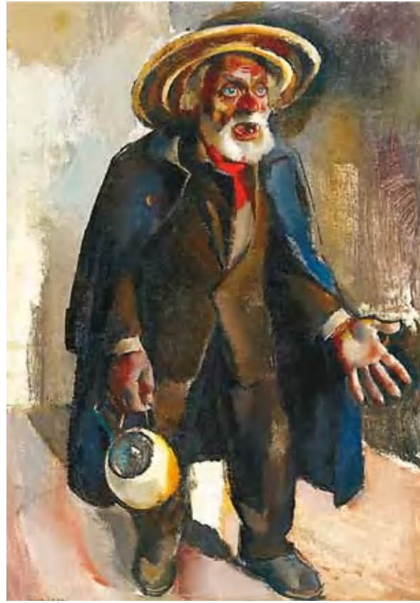
4. Aba-Novák Vilmos: A mérges Giovanni, 1929 magántulajdon

Az Utcai zenészek Aba-Novák római trattoria ciklusának lenyűgöző darabja, talán csak egy van, ami monumentálisabb, a Magyar Nemzeti Galéria tulajdonában álló Tέρzene. Érdekes megfigyelni, hogy bár Aba-Novák és Patkó szorosan együtt és egymás mellett dolgoztak Olaszor-