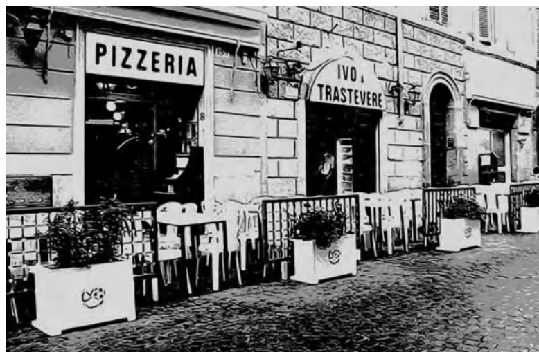
1. A Trastevere, Róma, 1930-as évek