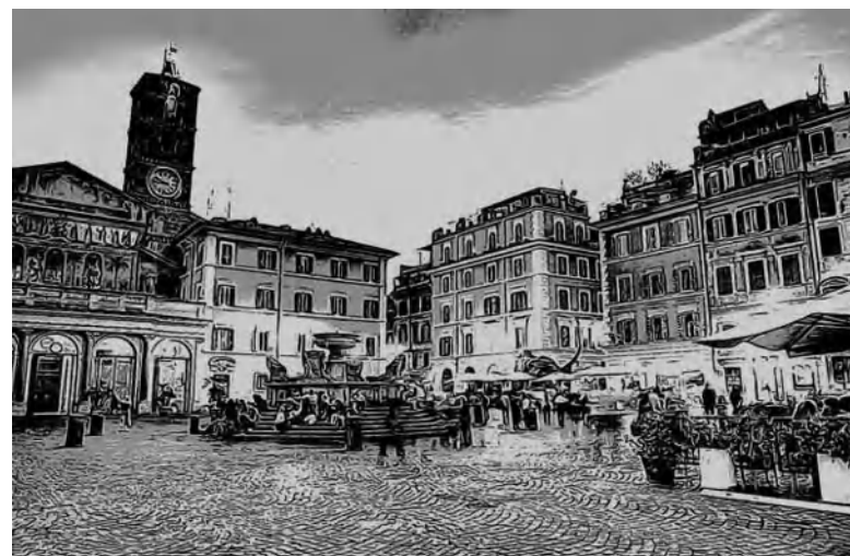
2. A Trastevere, Róma, 1930-as évek