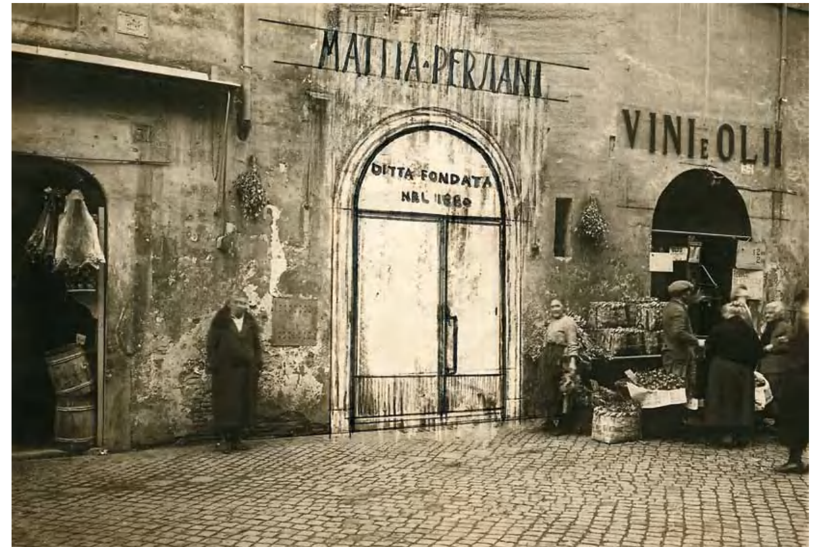
3. A Trastevere, Róma, 1930-as évek

A Római Magyar Intézet igazgatója, Gerevich Tibor a korszak egyik legnagyobb hatású művészettörténésze volt, akinek számos tevékenysége és erénye mellett a legjelentősebb talán a kiváló diplomáciai érzéke volt, kiváló olasz kapcsolatai révén fáradhatatlanul dolgozott az igazi „római magyar stílus” létrehozásán. És amit minden vele kapcsolatos írás megemlít, az a legendás Itália-imádata. Pártfogoltjait is arra buzdította, hogy a tanulás mellett éljenek is Rómában, utazzanak és szórakozzanak. „Gerevich [...] olaszosabb lett, mint az olasz, jobban ismerte Rómát, mint a római. Gerevich tudta, hogy Róma külvárosának melyik kocsmájában énekel egy öreg