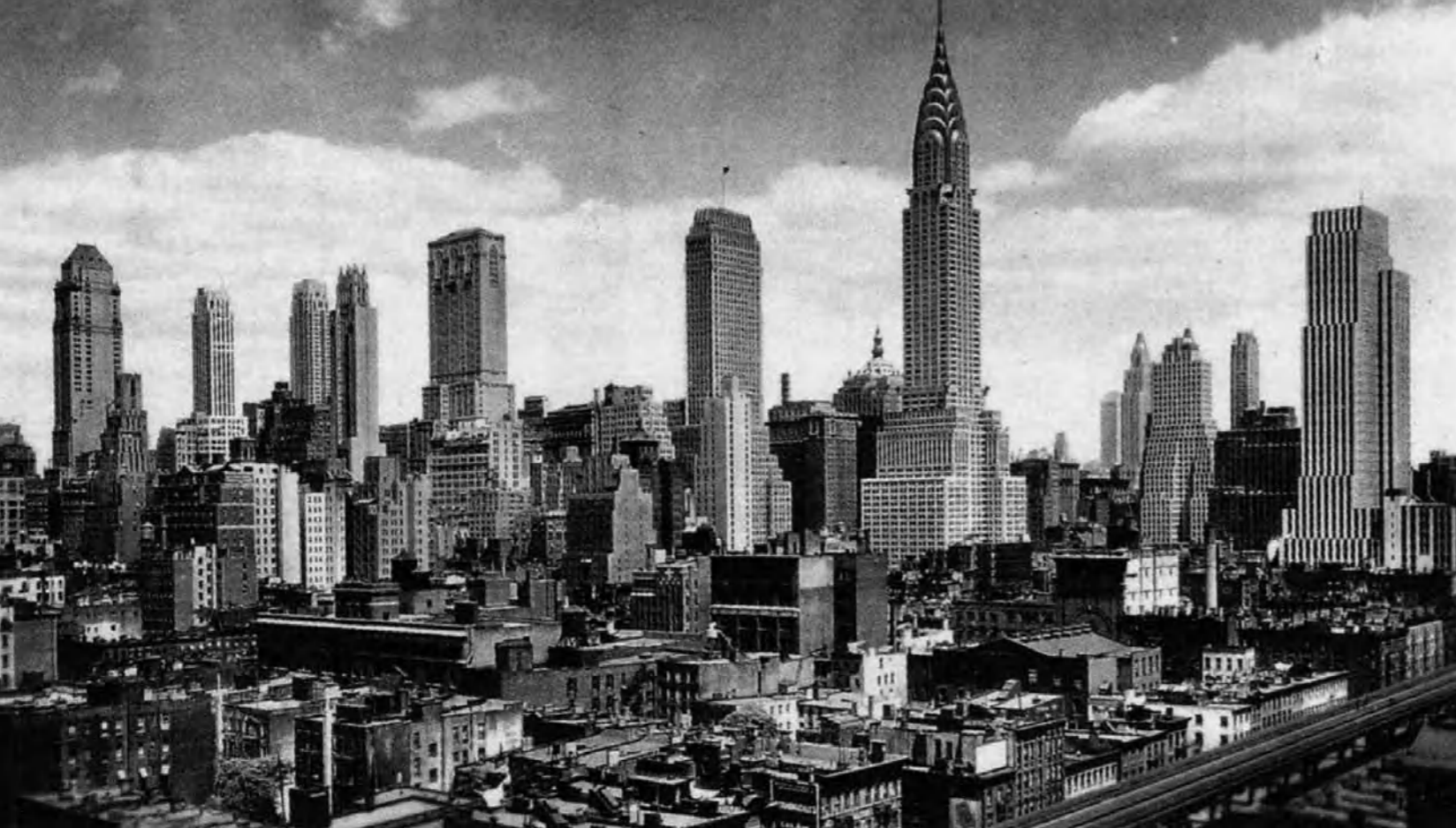
1. Manhattan Skyline, 1930