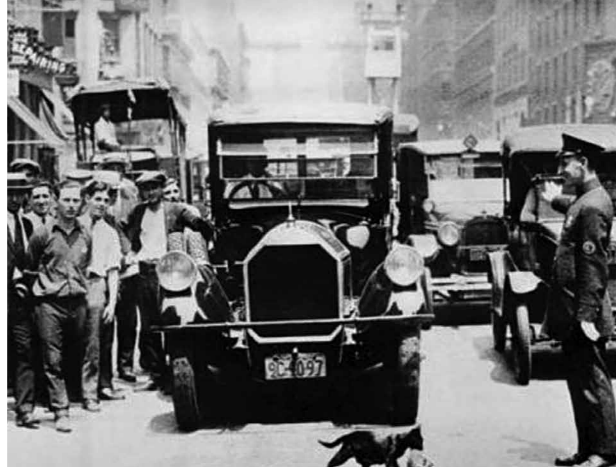
2. Közlekedési rendőr New Yorkban, 1920-as évek