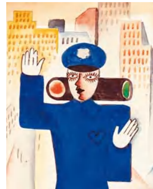
7. Tájékoztató a közlekedési lámpák működéséről, 1920-as évek