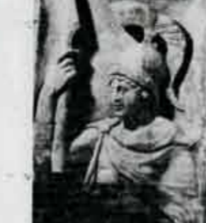
Roman sculpture relief that was stolen from an Italian museum but recovered.