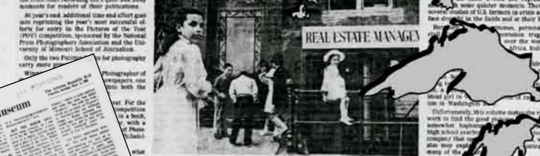
"Loisaida," a New York street-scene series, which won the Canon Essay Award.