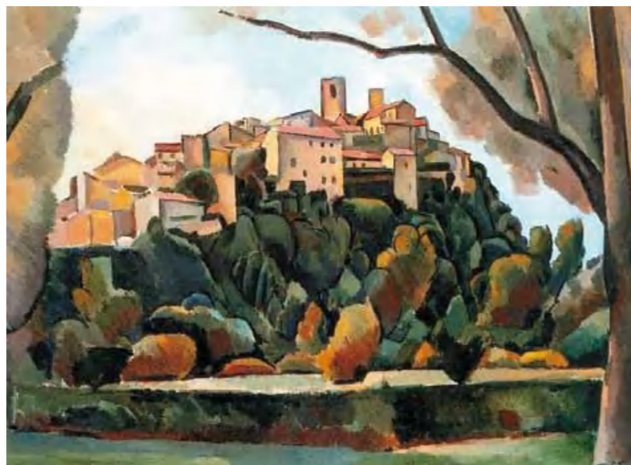
2. André Derain: Erdőrészlet, 1908-1909 körül, Art Institute, Chicago