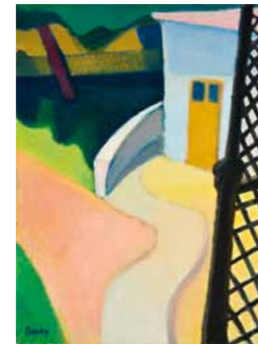
1. Berény Róbert: Napsütéses villakert, 1928-1930 körül magántulajdon