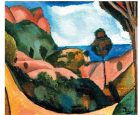
2. Andre Derain: Cassis melletti táj, 1907