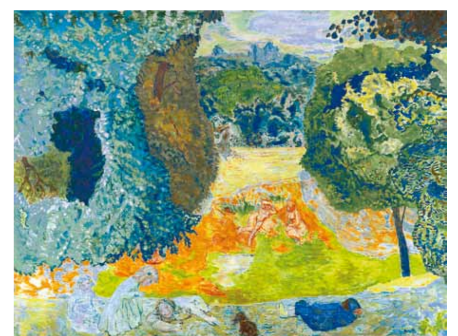
5. Pierre Bonnard: Kert, 1935 körül The Metropolitan Museum of Art, New York