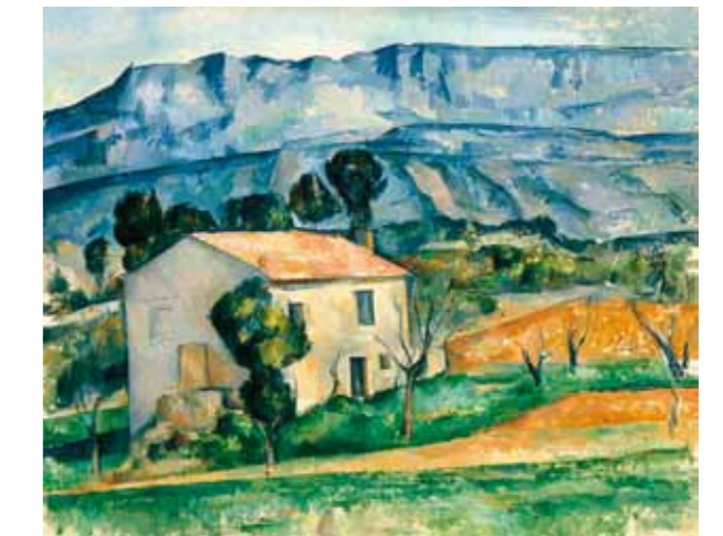
3. Paul Cézanne: Provence-i ház, 1885, Indianapolis Museum of Art, Indianapolis, Indiana

Fenyő György édesapja, a Nyugat című folyóirat alapító-szerkesztője, Fenyő Miksa révén egy meglehetősen szerencsés, üdítően pezsgő szellemi közegben nőtt fel. Családja közvetlen baráti társaságához tartozott a folyóirat szinte minden karizmatikus alakja; a Nyugat felvilágosult, humánus értékeket alapul vevő kozmopolita jellegéből pedig az következett, hogy Fenyő szoros kapcsolatba kerülhetett a korabeli progresszív szellemiségű képzőművészet meghatározó alakjaival is.