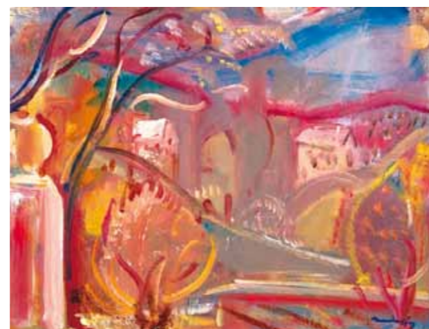
3. Márffy Ödön: Fák házzal, 1940 körül magántulajdon

Márffy Ödön élete folyamán többször járt Olaszországban. A turizmus elterjedésével, növekedésével párhuzamosan napfényes tengerpartjai az európai polgárság körében is egyre népszerűbb úti célok lettek, de a 20. század első évtizedében a művészek és értelmiségiek még inkább a városokba mentek, hogy helyben tanulmányozzák az itáliai művészetet. Márffy 1907 novemberében utazott először pár hónapra Firenzébe, ahol már egy kisebb magyar művészeti kolónia volt kialakulóban (Fülep Lajos, Vedres Márk, Kalmár Elza, Lukács György). Keveset dolgozott, inkább pihent és élményeket szerzett, valamint korabeli levelezése szerint már ekkor is inkább az olasz táj szépsége ragadta meg: „Azok a nagy magános séták, melyeket