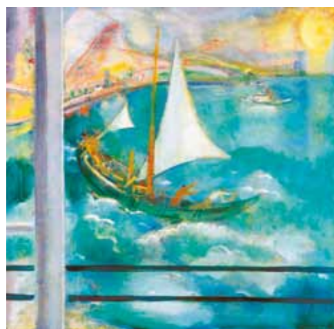
1. Márffy Ödön: Halászkor az öbölben (Vitorlás), 1937 körül magántulajdon