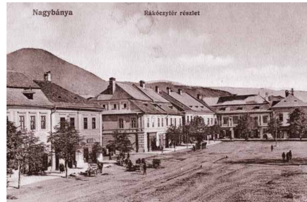
1. Nagybánya, Rákóczi-tér