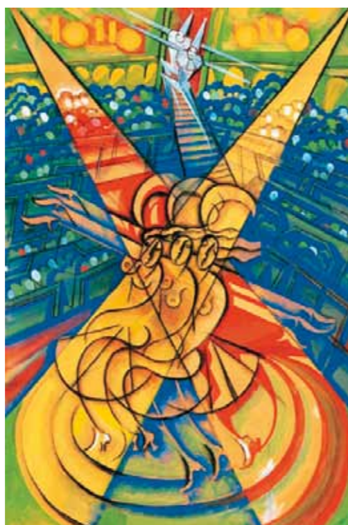
1. Scheiber Hugó: Cirkusz, 1925 körül magántulajdon

A könyvet szerkesztette és kiadja a Bozsán család, Pauker nyomda Kft., Budapest, 2010, 61. oldal