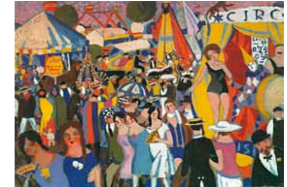
3. Salvador Dalí: Santa Creus Festival in Figueras (The Circus), 1921 magántulajdon

ben a vásznain tobzódó foltok és formák, a felhalmozott matéria és sok apró, különálló, íves ecsetvonás gazdagítja kompozícióit. 2 1923-24 körül költözött Berlinbe, ahol a portrérajzolás mellett számos nagyobb, reprezentatív olajképet is festett, vagy ezeknek a későbbi kidolgozásához készített vázlatokat. Scheiber az expresszionizmus, majd a futurizmus irányzata felé fordította érdeklődését; széles síkokra bontott motívumok, tisztán vezetett kontúrok, leegyszerűsített vonalvezetés és élesen világító színek domináltak munkáin. 3 A német főváros hatására kedvelt témájává vált a metropolisz pezsgő világa, és annak szokványos helyszínei – a berlini Lunapark, bál- és orfeumjelentek, cirkuszi produkciók, sportaréna, városi forgatag stb. –, melyeket ebben az időben többnyire olajképeken rögzített. „Nincs kín és nincs probléma az ő művészi világában, csak pezsdítő, hahotázó szencziációk vannak. Ő rájött arra, hogy kár a nagy gőzért és főleg kár a tépelődésért. A világ szép ahogy van, különösen a világvárosban: a cikkázó, röplő, zúgó, süvöltő, visító, sikongó, tolakodó, törekedő, villámló és nyilaló jelenségek sokrétű ritmusa; madárőrserű topánka, durrogó palack, hullámszélű