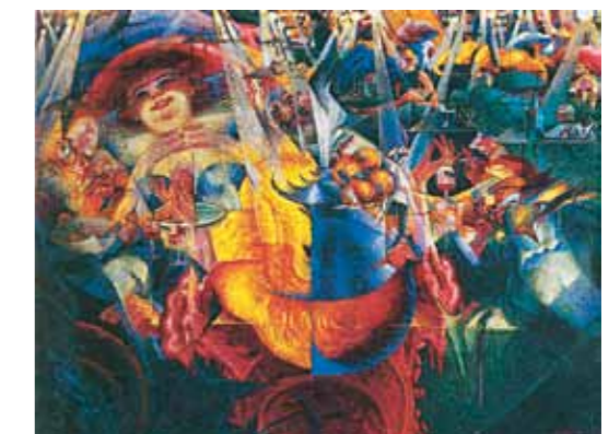
5. Umberto Boccioni: The Laugh, 1911 MoMA, New York