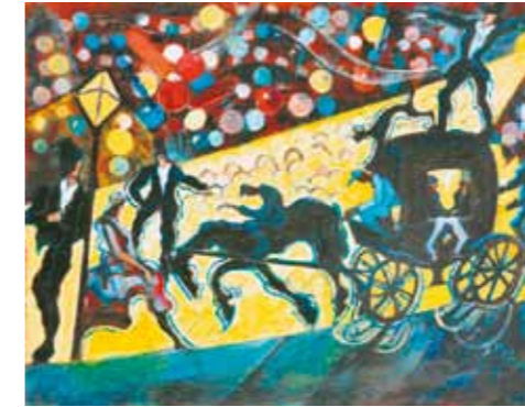
2. Scheiber Hugó: Utcai forgatag magántulajdon