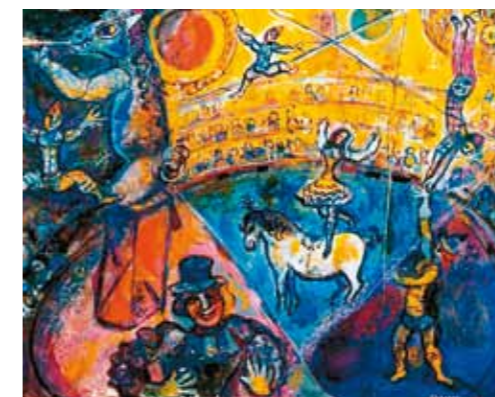
4. Marc Chagall: The Circus, 1964 magántulajdon