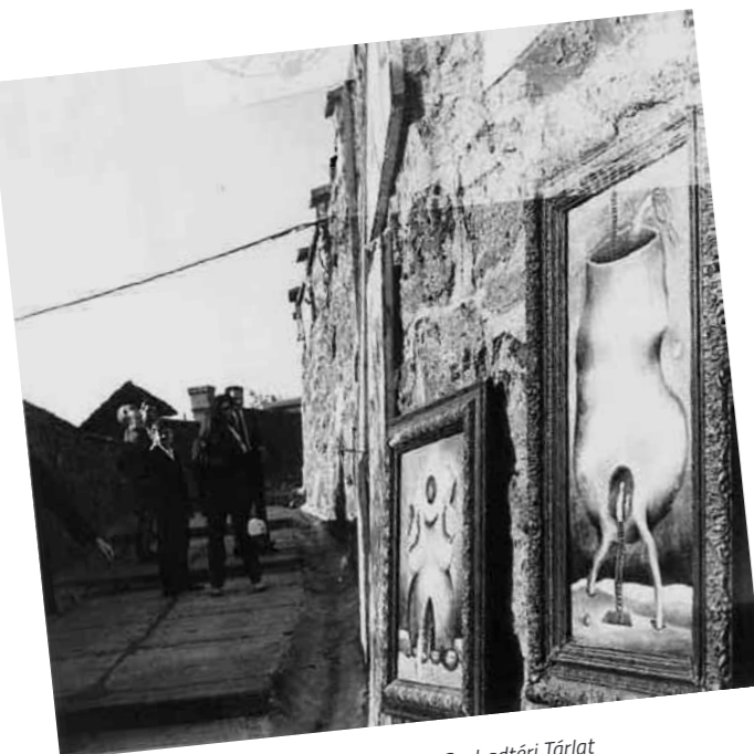
1. A II. Szentendrei Szabadtéri Tárlat a Templomdombon. A falon a Születés című sorozattal, 1969

Kezdő ár | Starting price: 2 000 000 Ft / 5 556 EUR Becsérték: 3 000 000 - 4 000 000 Ft Estimate: 8 333 - 11 111 EUR