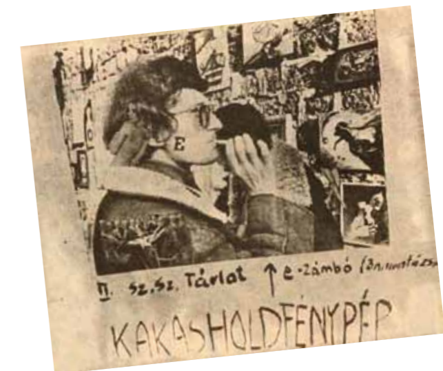
4. E'4-es rögtönzött utcai tárlaton (ef. Zámbo a II. Szentendrei Szabadtéri Tárlaton), 1969

csupán az arc, valamint a végtagok lehetnek fedetlenek. Ráadásul ez a (Istenszülő) test már üres, mintha a lélek elszállt volna belőle, mint amikor a tengeri csiga elhagyja házáat. A magyar képzőművészetben – többek között – Vajda Lajos, Korniss Dezső, Kondor Béla festészetében találni hasonló „ikonos” képeket. ef. Zámbo az ő útjukon haladva, eleinte szürrealista, majd dada és pop elemekkel gazdagította e hagyományt.