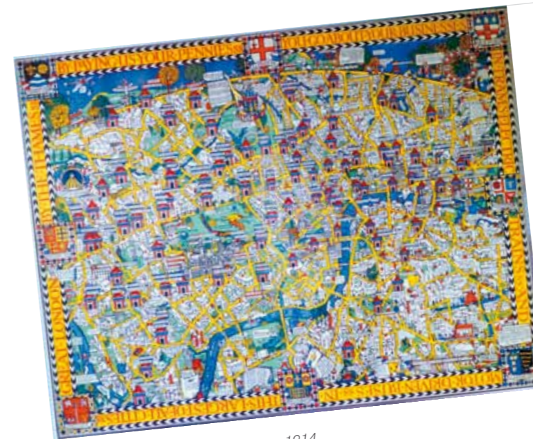
3. Max Gill: London mesetérképe, 1914, London Transport Museum