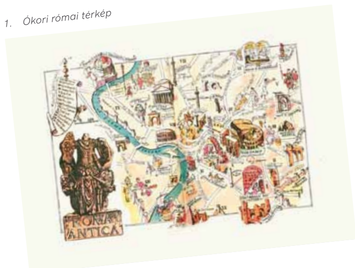
1. Ókori római térkép