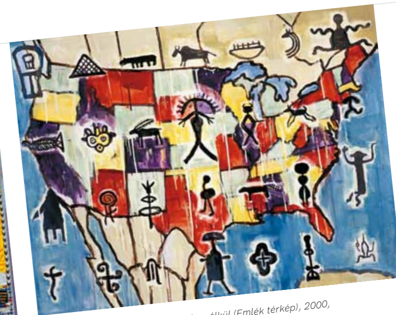
4. Jaune Quick-to-see Smith: Cím nélkül (Emlék térkép), 2000, a művész tulajdonában

hanem inkább a határok eltörlésének szándéka, vagy mint Kovalovszky értelmezésében a „világszönyeg” kialakítására irányuló törekvés. Ujházi életművének jellegzetes vonása a személyesség (otthonosság) és kívülállás kettősége. Mindez megjelenik a különböző nézőpontok szimultán szerepeltetésében, a sajátos térképezésben, a magányos alakokban, és vele szemben az arctalan valós vagy elképzelt emberközösségek rendezetlen tömegében. Várnagy Tibor szerint Ujházi tekintete a kívülálló pillantása, alkotása pedig a meglátottak naplószerű rögzítése. 2 Utazásait, személyes élményeit is rendszeresen művekkel dokumentálta, ciklusokba csoportosította (pl. Nadapi-képek, Paris-, New York- vagy Lisszabon-sorozatok). Ujházi 1991-ben elnyerte a Római Akadémia ösztöndíját, és ennek hatására készítette – többek között – a Róma előtt és után (1991) című dobozművét, az Utazó vagy Rómaósz (1991) kollázsát, vagy a Szőlőgyűjteményben található Római térképvázlat (1993) festményét, melyek egytől egyig az Ujházi-alkotások egy-egy jellegzetes típusának képviselői is lehetnének.