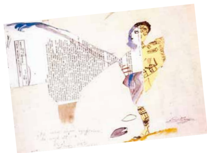
2. Ujházi Péter: Utazó, 1991, magántulajdon