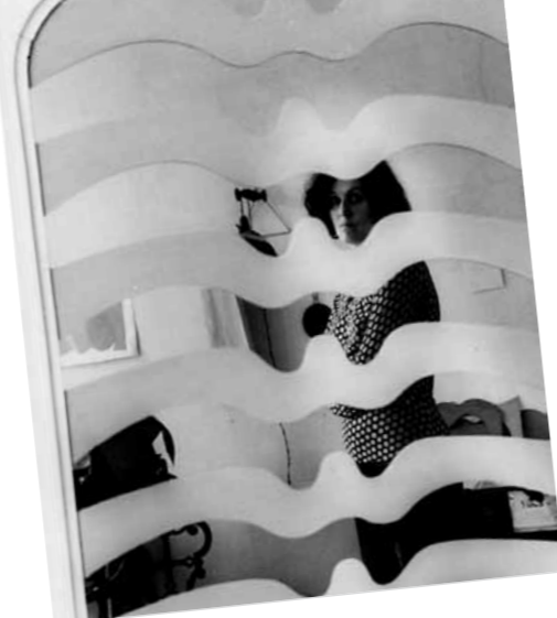
1. Keserü Ilona portréja