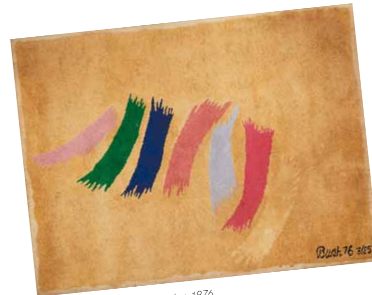
2. Jack Bush: Untitled Tapestry, 1976 magántulajdonban