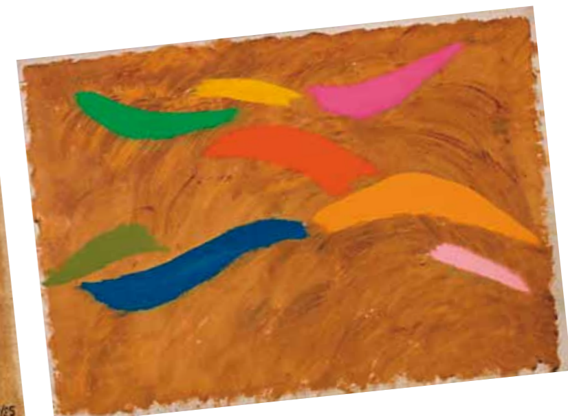
3. Jack Bush: Jeté en l'air, 1976 magántulajdonban