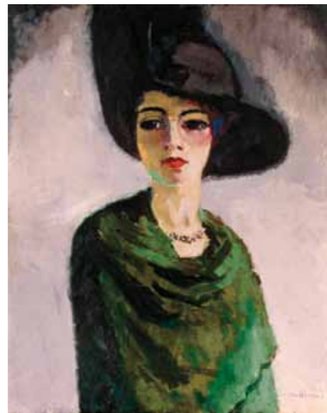
2. Kees van Dongen: Fekete kalapos nő, 1908