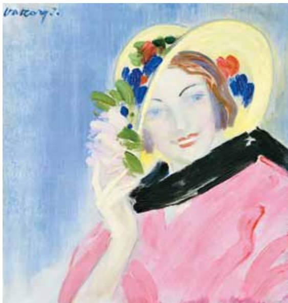
1. Vaszary János: Nő, virágos kalapban magántulajdon