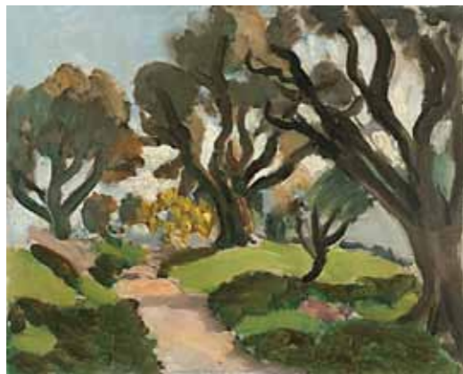
5. Henri Matisse: Tájkép, 1918, magántulajdon