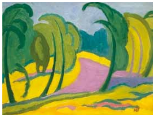
8. Mattis Teutsch János: Hajladozó fák, 1918, magántulajdon