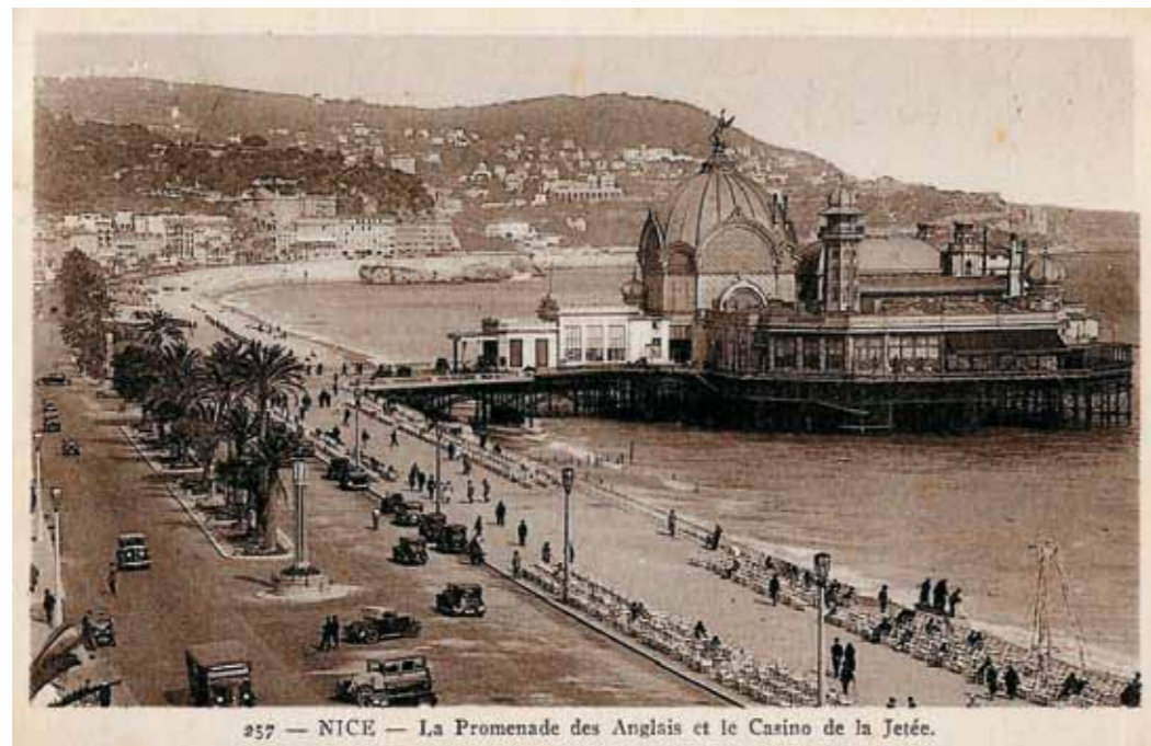
1. Nizza, képeslap

Néhány majdnem találmásra kiragadott, Magyarországot érintő hír 1927-ből: Január 1. Új fizetési eszköz, a pengő került bevezetésre az elértéktelenedett korona helyett. Július 24. A londoni sakkverseny Magyarország győzelmével végződött. Szeptember 22. László Fülöp, a híres magyar festő, Budapestre érkezett. A művész azért jött, hogy Horthy Miklós kormányzó arcképét megfesse. November 18. Gróf Klebelsberg Kuno vallás- és közoktatásügyi miniszter beterveztette a numerus clausus módosításáról szóló törvényjavaslatot. November 25. Rippl-Rónai József, a nagy magyar festő meghalt. December 31. Az éjjeli sínautójáratok megindultak.