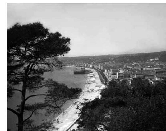
3. Kilátás a várból, Nizza, archív felvétel

A pálmafa és agave vadon nő végesvéig a tengerparton és a hegyoldalban. Olajfa, mirtus, oleander árnyékolja be az utakat, narancskertek virítanak a hegy oldalán, szabadon nő a mandarin, a banán, a citrom, a füge, a datolyapálma, a gránátalma, a jánoskenyérfa és mindenféle a pálmák és ciprusok. Nice (a legtöbb európai nyelven Nizza), a francia Riviera legnagyobb városa, mint egy hosszú diadém közepén csillogó nagy drágakő, valami különös természetességgel egyesíti magában a nagyvárost és a fürdőt, a kultúra ragyogását és a tengervidék romantikáját, a luxusba szédülő életet és évszázadok patinás hangulatát. Sokszínűségében szinte minden oldaláról más és más képet mutat.”