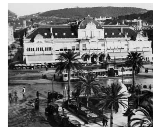
4. Franciaország, Nizza, Place Masséna, Városi Kaszinó (Casino municipal), 1935