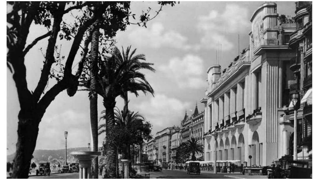
2. Franciaország, Nizza, Promenade des Anglais, jobbra előtérben a Palais de la Méditerranée, 1933, Fortepan