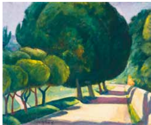
7. Czigány Dezső: Provance-i fasor, 1930 körül, magángyűjtemény