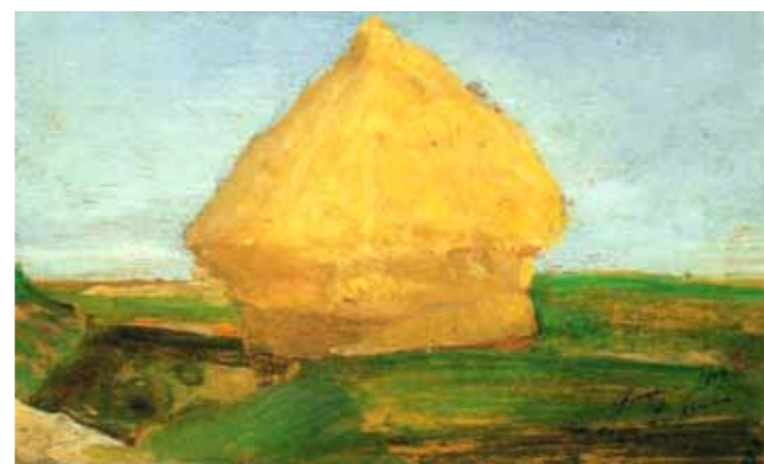
3. Paul Signac: Szénaboglya, 1882 magántulajdon

Czigány Dezső majd másfél évnyi párizsi tartózkodást követően 1906 áprilisában érkezett vissza Magyarországra. Előbb Budapesten, majd Nagybányán időzött, de a nyarat már a szabadiskolától függetlenül dolgozva töltötte. Czöbel egy lépéssel bátrabban, ezen a nyáron itt festette meg első fauve képeit, Czigánynak azonban még szüksége volt pár hónapra, hogy szintén fauvos periódusába lépjen. Az ekkor szintén Nagybányán dolgozó Ferenczy Károlyt választotta mesteréül, így ennek megfelelően posztimpreszionista tájképekkel és naturalista