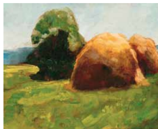
2. Hollósy Simon: Szénaboglyák, 1910-es évek magántulajdon