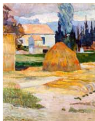
1. Paul Gauguin: Arles-i táj, 1888 Indianapolis Museum of Art, Indianapolis