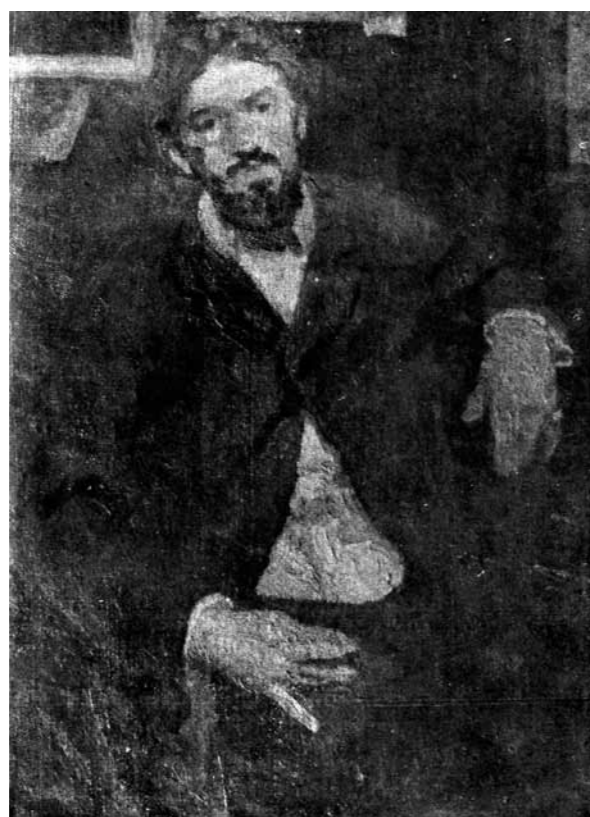
1. Czöbel Béla: Dobai Székely Andor portréja, 1905

Dobai Székely Andor a korai magyar modernizmus legizgalmasabb és egyben legismeretlenebb alakjainak egyike. Neve a századfordulón bukkant fel először, a nagybányai Hollósy-iskola növendéke volt. Hollósy Simon Nagybányáról való 1902-ben történt végleges távozása után, Székely követte mesterét Münchenbe. Innen Párizsba ment, ahol a Julian Akadémiát látogatta. 1905-ben egy brugge-i képével szerepelt a