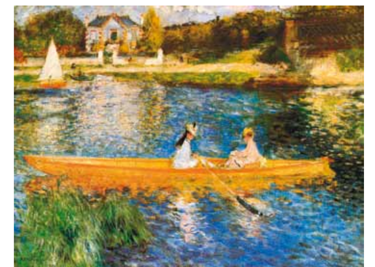
5. Pierre-Auguste Renoir: A Szajna-part Asniers mellett, 1879