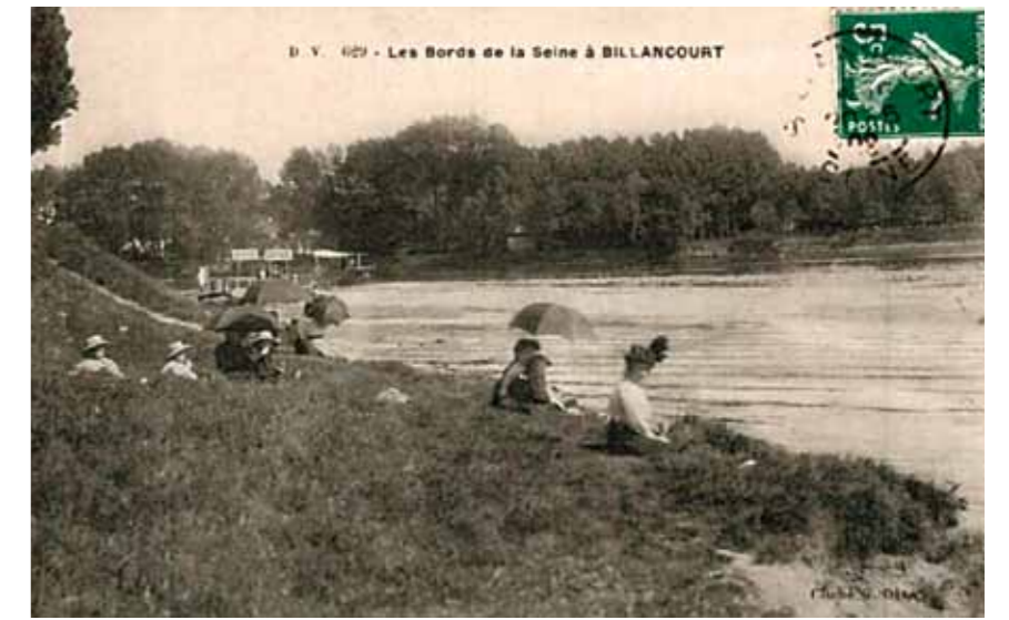
3. Fürdőzők a Szajna-parton, 1900-as évek Archív fotó

tizedben, több mint négyszáz (!) művét állította ki külföldön és itthon. Budapesten bemutatott alkotásainak legtöbbjével az Országos Magyar Képzőművészeti Társulat műcsarnoki és a Nemzeti Szalon tárlatain találkozhatott a közönség, tehát meglehetősen ismert művészeknek számított. Hol lehetnek a művei?