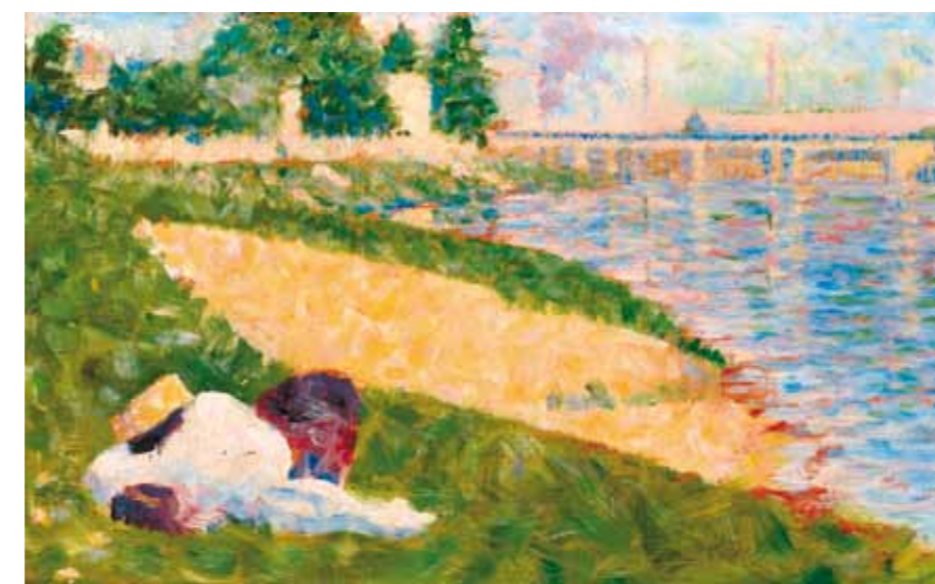
4. Georges Seurat: Ruhák a Szajna-parton, 1883-1884 National Gallery of Art, Washington