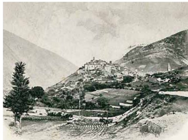
3. Scanno, l'Aquila megye, Abruzzo régió, archív felvétel

„A piktúra teljesen megfelel, mint narkotikum, én pedig állandóan élek vele” – írta Aba-Novák barátjának, Márk Lajosnak 1929 novemberében Rómából. Szinte az egész életét Itáliában töltötte, s mivel az átépítés alatt álló római intézet még csak felibe-harmadába volt képes megfelelő módon fogadni az ösztöndíjasokat (a teológusok miatt nőművész például nem is lehetett közöttük), így Aba-Novák, összekötve a kénytelent a kellemessel és a hasznossal, az év fo-