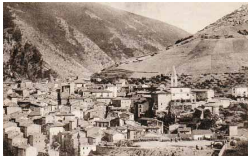
2. Scanno látképe, l'Aquila megye, Abruzzo régió, archív felvétel