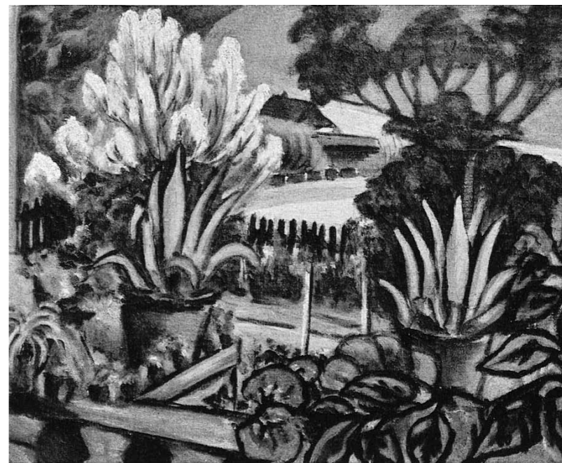
6. Stanislaw Stuckgold: Magyarországi kert (Ungarischer Garten), lappang közli: Deutsche Kunst und Dekoration, 1917, 345. oldal