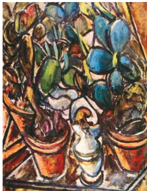
3. Galimberti Sándor: Kaktusz csendélet, 1910 körül magántulajdon