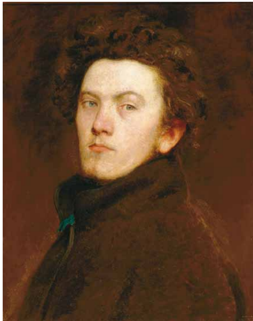
2. Székely Bertalan: Önarckép , 1860 Szépművészeti Múzeum – Magyar Nemzeti Galéria