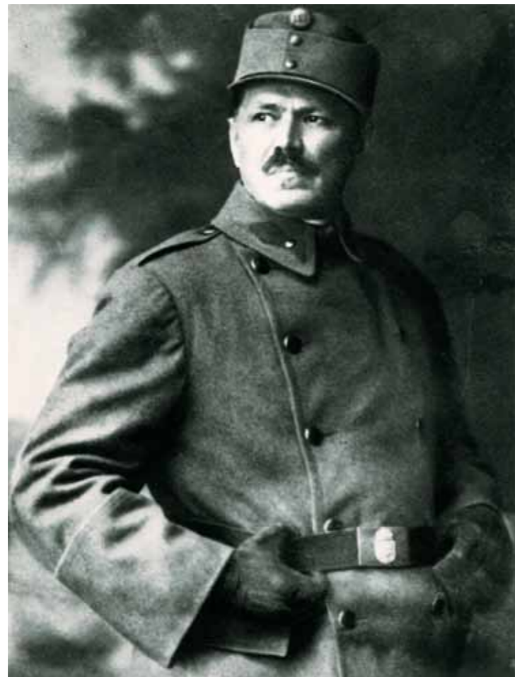
1. Vaszary János katonaruhában, 1914-1918 Szépművészeti Múzeum – Magyar Nemzeti Galéria