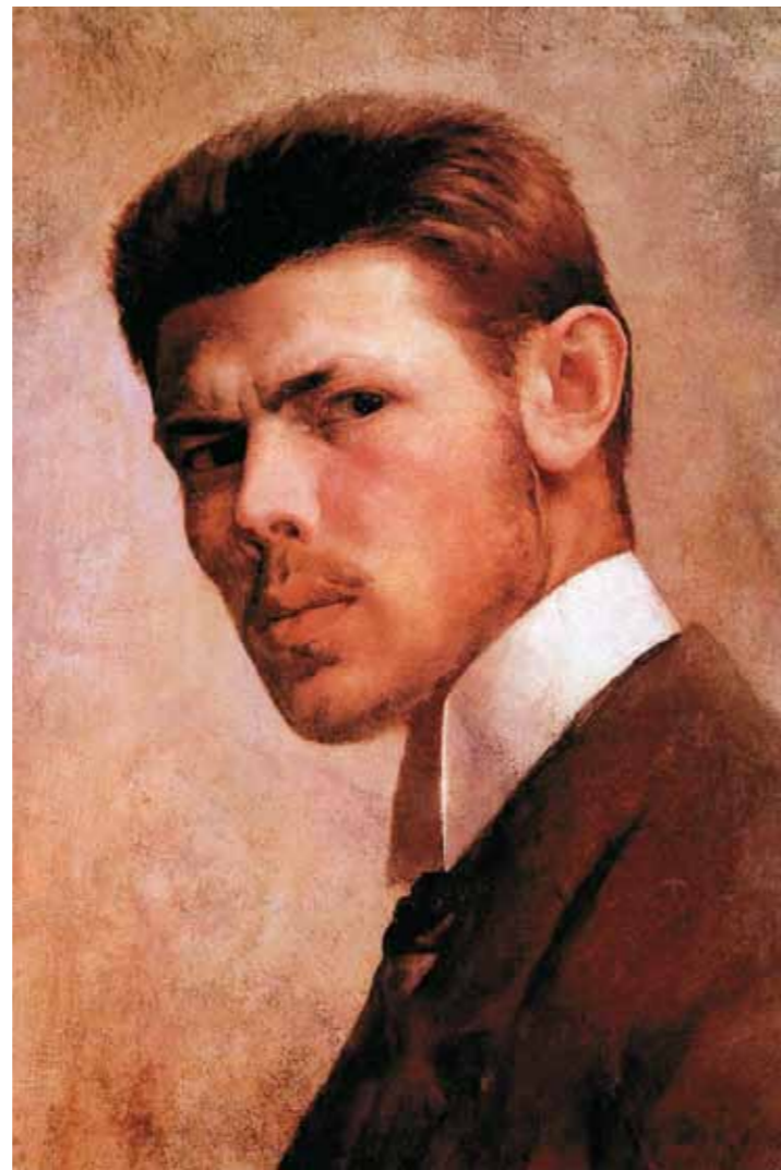
3. Vaszary János: Önarckép , 1887 Szépművészeti Múzeum – Magyar Nemzeti Galéria