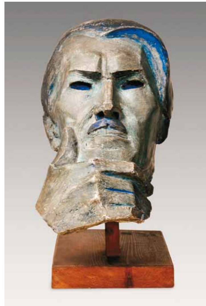
4. Vaszary János: Önarckép , 1931 Szépművészeti Múzeum – Magyar Nemzeti Galéria