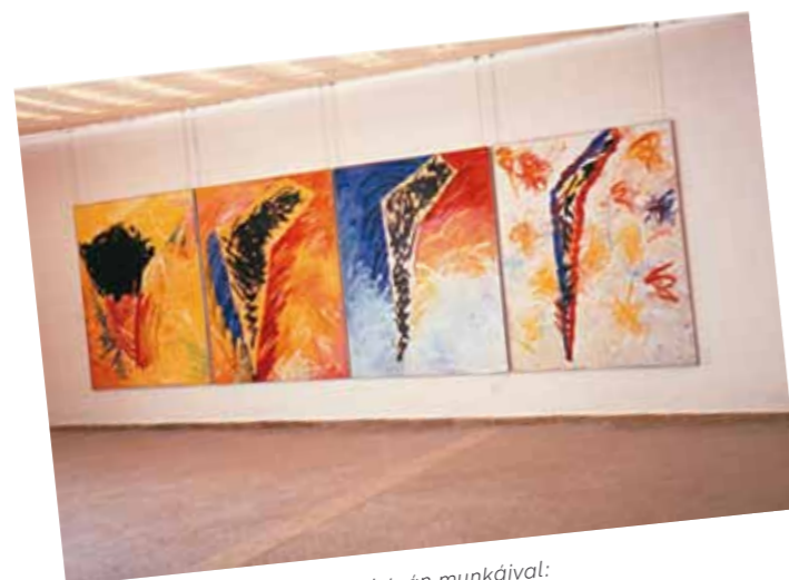
1. Kiállítási enteriőr Nádler István munkáival: Hommage à Malevics I-IV. (1985)

| Neue Sensibilität. Ungarische Malerei der 80er Jahre, Galerie der Stadt Esslingen - Villa Merkel 1987. január 23. – március 1. (címlapon)