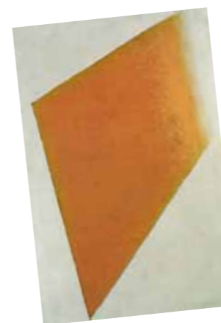
2. Kazimir Malevics: Yellow Plane in Dissolution, 1917 Stedelijk Museum, Amsterdam