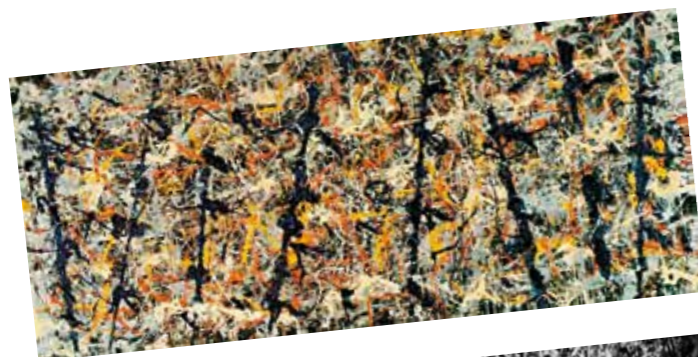
1. Jackson Pollock: Blue Poles, Number 11, 1952 National Gallery of Australia, Canberra, Australia