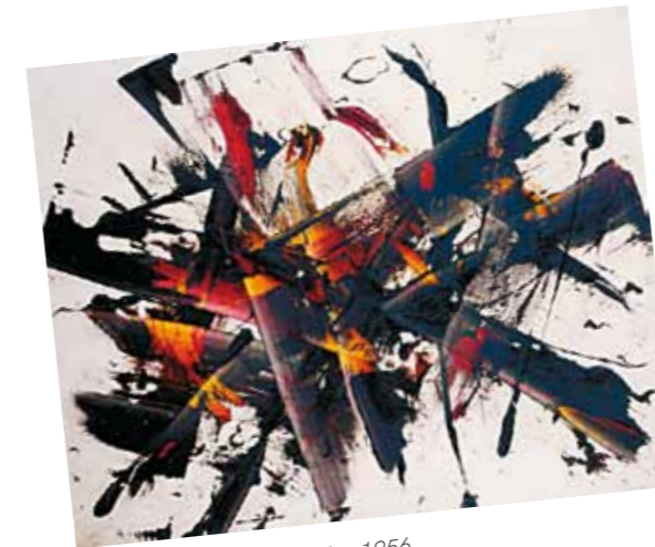
3. Reigl Judit: Robbanás, 1956 magántulajdon