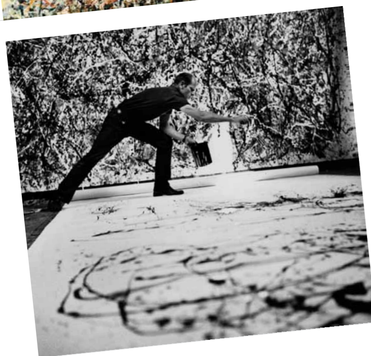
2. Jackson Pollock festés közben, 1950 Hans Namuth fotója, Dallas Museum of Art, Dallas, USA